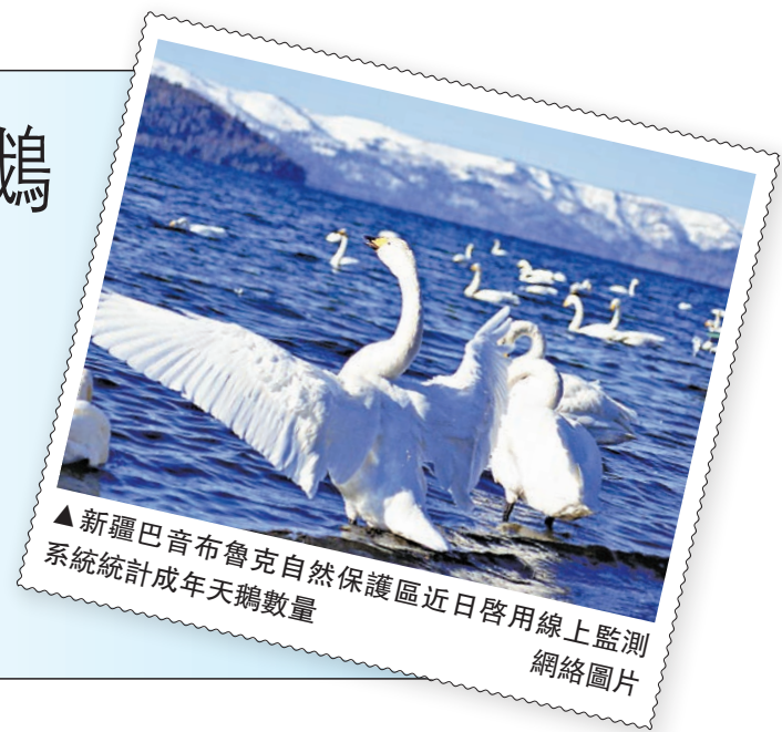
▲新疆巴音布魯克自然保護區近日啓用線上監測系統統計成年天鵝數量 網絡圖片

為研究和保護天鵝，幾年前，新疆就在巴音布魯克自然保護區建成線上監測系統。由於草原周遭山高谷深，通電難度極大，只能使用太陽能，這一監測系統無法正常工作，大多數時間處於閒置狀態。保護區管理人員只能放着先進的監測設備，用「肉眼」數天鵝。（新華社）