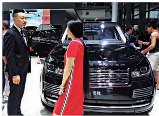
▲購車者詳細詢問路虎新車的性能 大公報記者李昌鴻攝