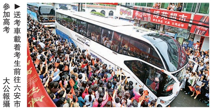
▲送考車載着考生前往六安市參加高考

6月5日上午8點08分，安徽省六安市毛坦廠中學再度迎來傳統的「送考節」。28輛送考車載着考生前往六安市參加高考。警車為考生開道，道路兩邊送考家長為奔赴考場的孩子加油助威，拍照留念。據了解，每年高考前，毛坦廠中學每半年都會用大巴車集中將參加高考的學生，送至六安市市區的各個考場周邊，提前「安頓」下來，迎接即將到來的全國高考。萬人陪讀，萬人送考，已成為這個小鎮上一道獨特的風景。