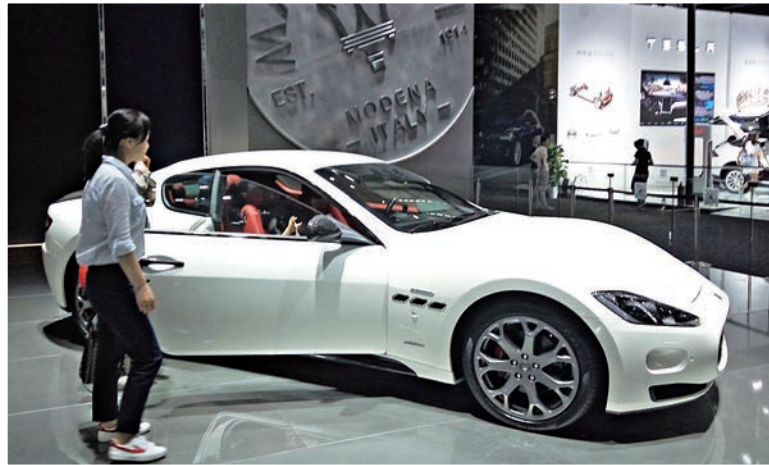
▲瑪莎拉蒂跑車賣200多萬元人民幣，也受到一些內地富豪青睞 大公報記者李昌鴻攝

由於國家推出新能源汽車購買鼓勵政策和許多城市限購，不受限購影響的新能源汽車受到許多消費者追捧，記者從比亞迪、上汽和廣汽等獲悉，其新能源汽車銷售出現爆發性的成倍增長，其中上汽今年4-5月混合動力汽車銷售近3000輛。