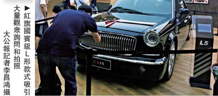
▲紅旗國賓級L形款式吸引大量觀眾詢問和拍照 大公報記者李昌鴻攝

6月5日上午8點08分，安徽省六安市毛坦廠中學再度迎來傳統的「送考節」。28輛送考車載着考生前往六安市參加高考。警車為考生開道，道路兩邊送考家長為奔赴考場的孩子加油助威，拍照留念。據了解，每年高考前，毛坦廠中學每半年都會用大巴車集中將參加高考的學生，送至六安市市區的各個考場周邊，提前「安頓」下來，迎接即將到來的全國高考。萬人陪讀，萬人送考，已成為這個小鎮上一道獨特的風景。