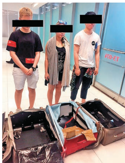
三男女疑為八千元販運一千一百萬元可卡因 網上圖片

有無人有興趣去十日旅行Inbox! 現招1男2女 $1xxxx-$2xxxx 下星期二飛