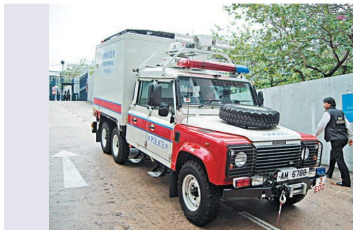
▲據悉爆炸品處理課人員曾奉召到場 資料圖片