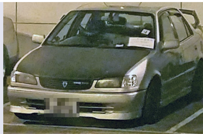
▲警署發現炸藥案，涉事私家車仍扣留在警署內