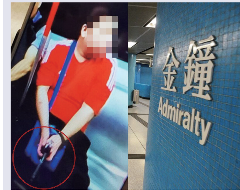
◀一名男子在港島線月台登上往中環列車，雙手緊握「手槍」 網上圖片