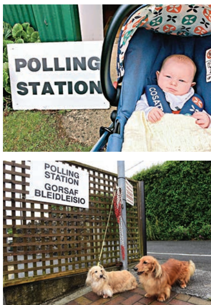
▶網民把嬰兒帶到票站 網上圖片 ▶英國人在網上晒票站外的汪星人 網上圖片