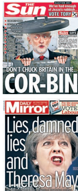
▶英國《太陽報》踩郝爾彬的頭版 網上圖片 ▶《每日鏡報》頭版斥文翠珊是騙子 網上圖片

立場偏右、被視為大選「預言帝」的小報《太陽報》，頭版大題「不要把英國丟到大垃圾桶(Cor-bin)了」，明顯用的是郝爾彬的名字(Corbyn)，批評郝爾彬是「恐怖分子之友」、「脫歐最沒用」和「工會的扯線公仔」。《每日郵報》頭版援引文翠珊前一天的演講，「讓我們重新點燃英國精神」。《每日郵報》選用了13頁攻擊郝爾彬以及工黨眾人，要求郝爾彬為「支持恐怖主義道歉」。左派的《每日鏡報》則用了近日在網上爆紅歌曲《騙子文翠珊》做頭版大題。(《衛報》)