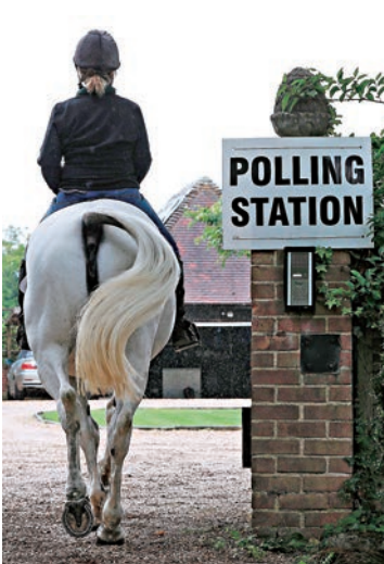
▶有英國人騎馬到票站

根據英國選舉規定，選民可以帶寵物到票站投票。從在去年英國脫歐公投開始成為票站新景的汪星人，8日繼續大出風頭。英國網民用#票站汪星人(dogs at polling stations)的標籤展開汪星人大賽，在票站開門不到兩個小時，已有超過8000條推特。有民衆把自家的馬也帶到票站，要在一群汪星人中殺出重圍。不過，汪星人和馬規定必須留在票站外綁好，帶兔子、鼩鼠或者寵物豬等，則必須交由票站工作人員看管。沒有帶寵物的選民則把自己的BB帶到票站，網上掀起「票站汪星人/BB/愛駒/其他寵物」大賽。政客們大選較高下，萌寵們要在網上爭破頭。(BBC)