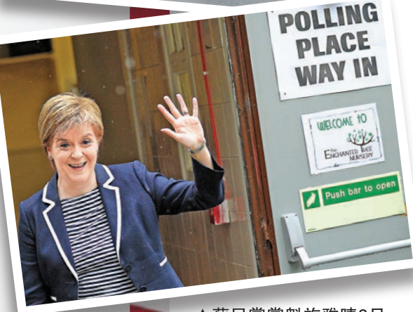
▲蘇民黨黨魁施雅晴8日離開票站