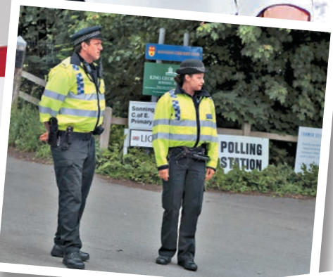
▶票站外有警察駐守