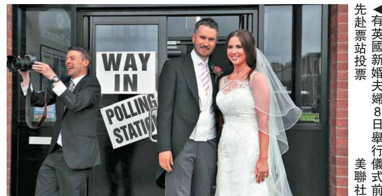
▶有英國新婚夫婦8日舉行儀式前赴票站投票 美聯社

他表示，在4月宣布提前舉行大選時，保守黨支持率遙遙領先，當時輿論幾乎一面倒地認為大選毫無懸念，保守黨會取得壓倒性勝利。雖然目前兩黨民調較為接近，但工黨難成爆冷黑馬，而保守黨也不會大熱倒灶。他預料保守黨最終能贏得議會多數，可以取得超過半數60至90個議席。任何政黨只要拿下326席過半數議席就可以組成政府。若是沒有一黨取得過半數議席出現懸峙議會，保守黨、工黨必須和其他小黨協商組成聯合政府，過程可能需要多天。