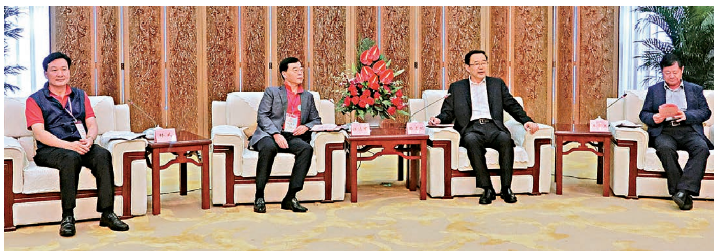
▲（左起）中聯辦副主任林武、專列團團長江達可、貴州省省長孫志剛、貴州省政協主席王富玉親切會晤

專列團隨後前往貴陽大劇院觀看極具特色的「多彩貴州風」大型歌舞演出，精彩的表演引得觀眾掌聲不斷，連連叫好。