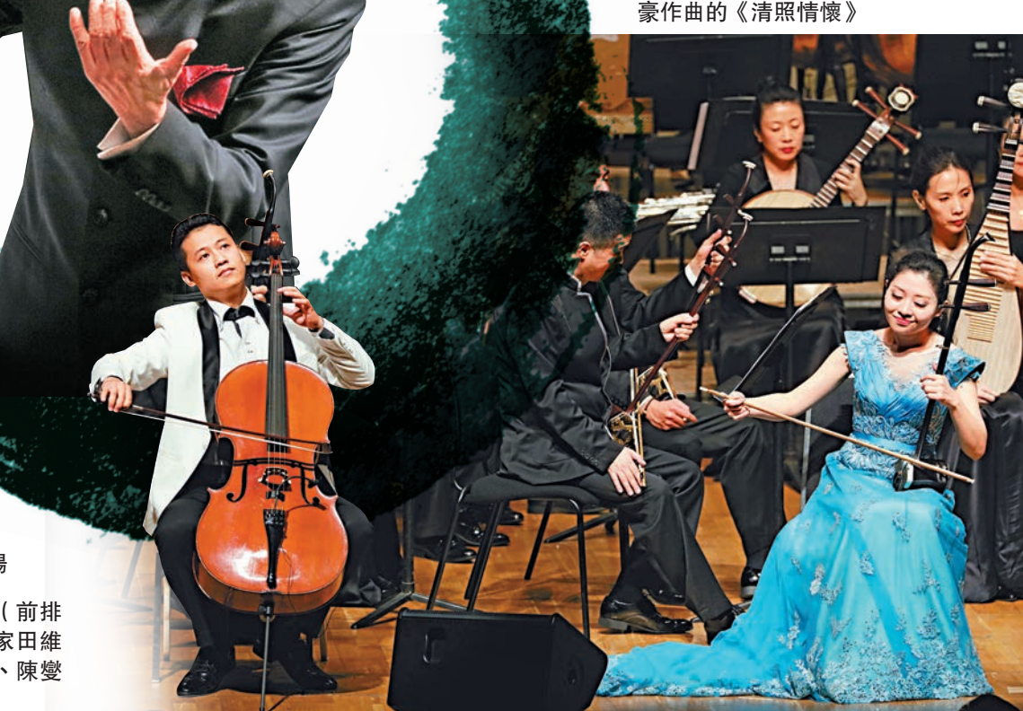
▲著名指揮家陳燮陽