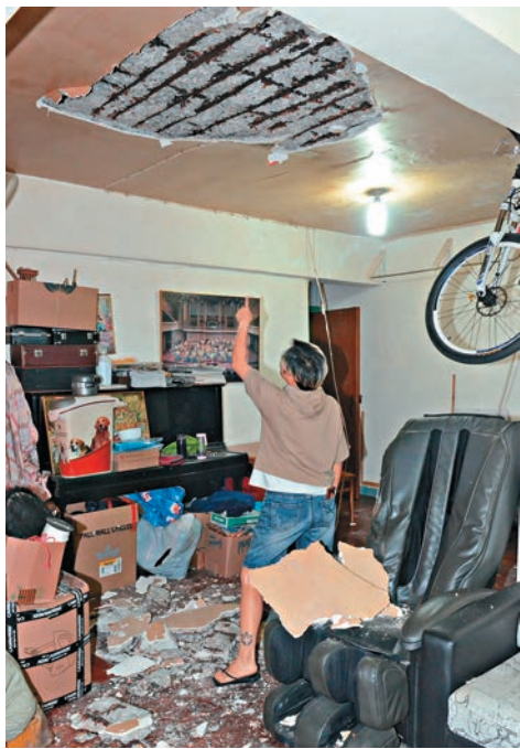
▲文苑街有單位天花大幅石屎批盪塌下

有執業大律師指，天花剝落事故如證實與樓上單位滲水有關，可向有關業主追討賠償，一般均能勝訴。至於因石屎剝落引致有人受傷，樓上業主雖難毋須負上其他法律責任，但會面臨更多的索償金額。