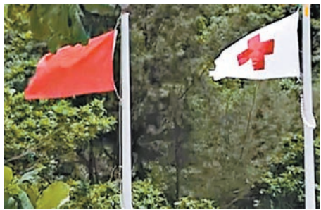
▲清水灣二灘高掛紅旗

同時，署方會聘請全職季節性救生員，及兼職時薪季節性救生員，填補空缺。根據過往經驗，隨著學生暑假開始，陸續會有學生加入季節性救生員的行列，有效改善人手不足問題。