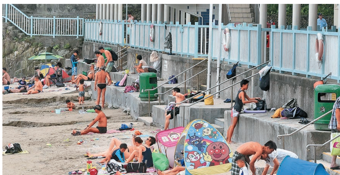
▲天氣炎熱，多個泳灘擠滿泳客。圖為銀線灣泳灘

酷熱天氣持續多日，各區泳灘在昨日周末均擠滿泳客，但在西貢廈門灣、銀線灣、清水灣第二灣共三個泳灘，19名救生員昨晨突然集體請病假，佔應有當值救生員人數的三分二，康樂及文化事務署宣布暫停全日救生服務。不少泳客到達泳灘後，才發現無救生員當值，有泳客冒險下水。有救生員工會指出，今年季節性救生員短缺創歷年之最，暑假仍欠200名救生員，人手不足問題在西貢與南區泳灘最嚴重。有泳客批評，救生員罔顧公眾安全，質疑爭取權益也應維持基本服務。