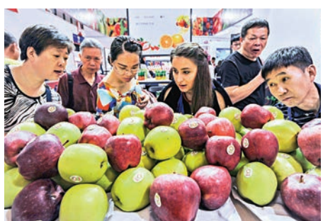
▲波蘭雙色蘋果初次登陸寧波廣受市民喜愛

波蘭館的展位被市民圍得水泄不通，一位忙着收錢的波蘭參展商說，沒想到蜜蠟在寧波這麼受歡迎。大約10分鐘時間，就有四位消費者下單購買，其中一款平安扣造型的蜜蠟吊墜，售價高達11500元人民幣。