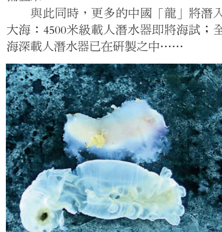
▲6月9日，「蛟龍」號在雅浦海溝完成第150次下潛。左圖為「蛟龍」浮出海面，右圖為從深海帶回的海參樣品