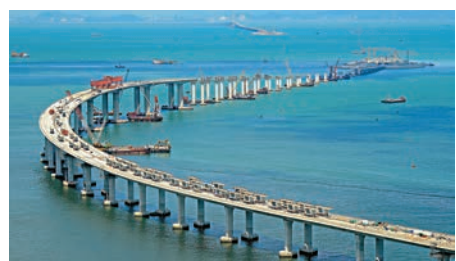
▲建設中的港珠澳大橋 資料圖片

對此，葉嘉安提出「前台後室」合作模式，即指香港的生產性服務業企業在內地設「前台」開闢市場，香港則作為「後室」提供生產性服務，為內地龐大的經濟體系服務。「香港的生產性服務業發展時間較長，加上香港自由的市場經濟環境和國際視野，以及「一國兩制」政策的便利，使得香港仍具有一定競爭優勢。」 中國社會科學院城市與競爭力研究中心主任倪鵬飛在當天的發言中建議，香港應當構建全球商業都會支撐「一帶一路」建設。他認為，在未來歐亞非一體化和中心化的大趨勢下，香港應轉變此前亞洲都會的定位，面向全世界打造全球商業都會。 在戰略布局方面，他提出，香港可把投資從內地向東南亞、印度和非洲轉移，為參與「一帶一路」活動中的企業服務，並充分釋放「一國兩制」的潛力配合國家「一帶一路」建設。