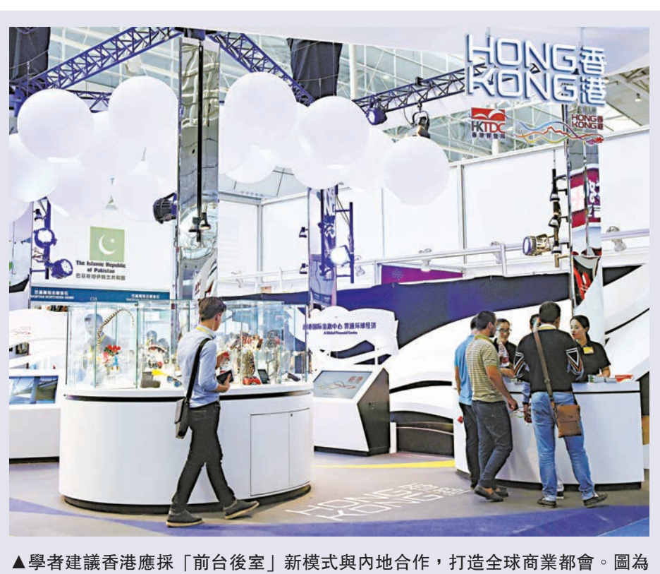
▲學者建議香港應採「前台後室」新模式與內地合作，打造全球商業都會。圖為第五屆中國—亞歐博覽會「香港館」