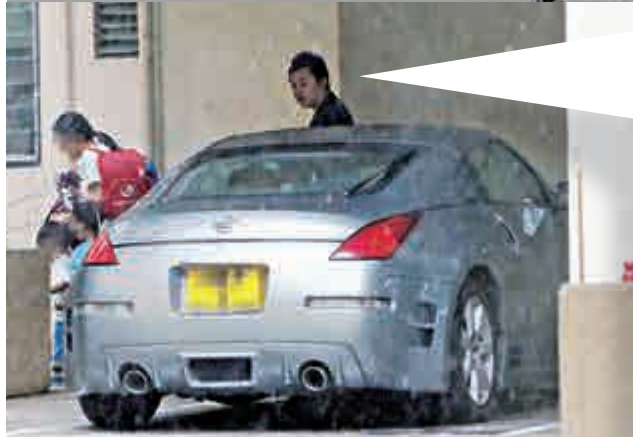
▲銀色日產車駛至麗晶花園停車場停泊，從司機位下車的男士