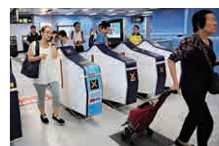
▲港鐵周日起提供八達通每程3%車費回贈，為期六個月

政府與港鐵早前就「可加可減機制」完成檢討，港鐵承諾今年不加價，並提供額外3%八達通回贈。港鐵昨日宣布，由