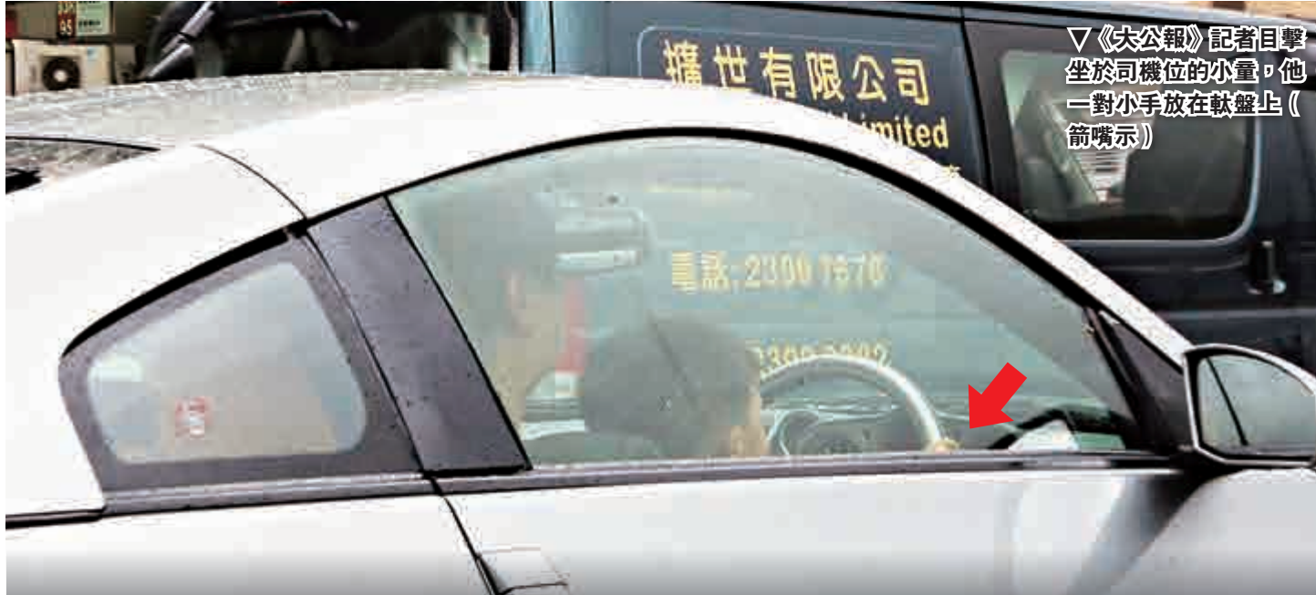
《大公報》記者目擊坐於司機位的小童，他一對小手放在軚盤上(箭頭指示)