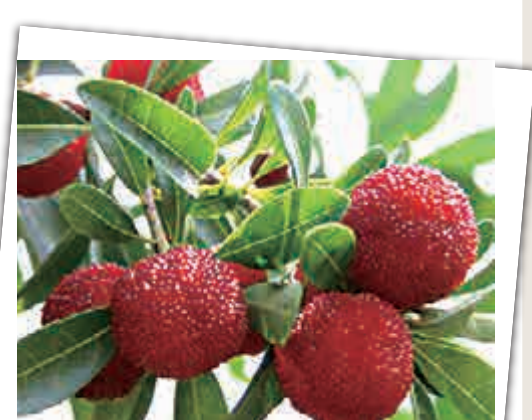
▲楊梅六月紅滿枝

之中，稱之爲「燒酒楊梅」。在赤日炎炎的盛夏，吃上幾顆燒酒楊梅，能消暑開胃，令人氣舒神爽。即便是身懷六甲，飲食皆需注意營養的孕婦也可適量食用楊梅，只因楊梅中含有檸檬酸、草酸、乳酸等可以幫助各位準媽媽緩解孕吐、促消化、一定程度上增加食慾。「鄉村六月芳菲盡，惟有楊梅紅滿枝」——有果中紅瑪瑙之稱的楊梅，願君多採食，一果解暑燭。