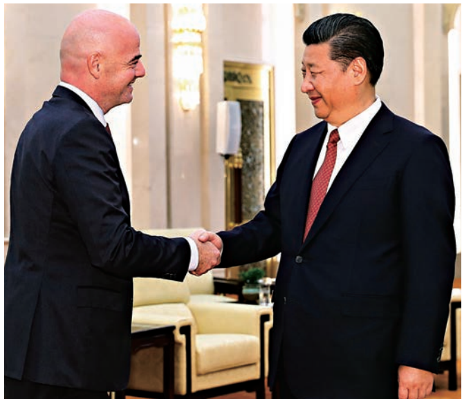
▶14日，中國國家主席習近平在北京人民大會堂會見國際足聯主席恩芬天奴