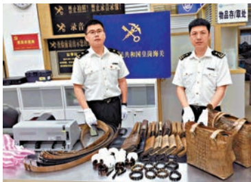
▲皇崗海關展示檢獲證物