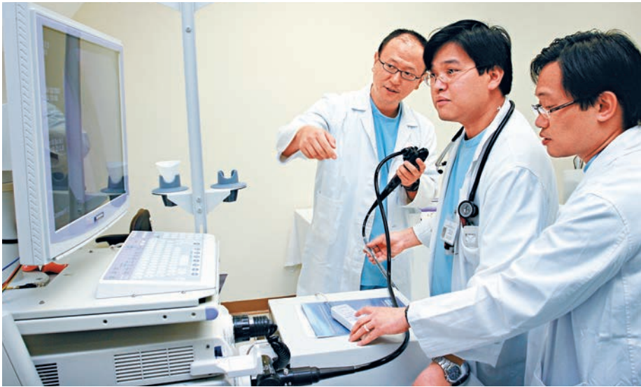
▲食物及衛生局完成本港醫療人力資源檢討，推算2030年將缺少2700名醫護人手，其中醫生缺1000人，較現時大增2.5倍

食物及衛生局局長高永文表示，本地醫護人手主要仍依賴本地培訓，而挽留醫生、有限度註冊都是輔助機制，但希望通過醫生註冊條例，改有限度註冊由一年升至三年後，可吸引更多海外醫生回流香港，中期目標能增加至數十名。至於醫科生學額，他強調，如有需要會繼續增加醫科學額，但培訓需時，未必能在近年發揮到作用。