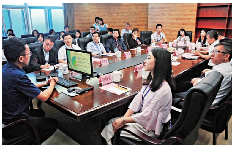
▲華僑大學招生辦人員在介紹中表示，華僑大學在港設有辦事處，目前每年招收三百名香港學生，歡迎更多港生報考華僑大學