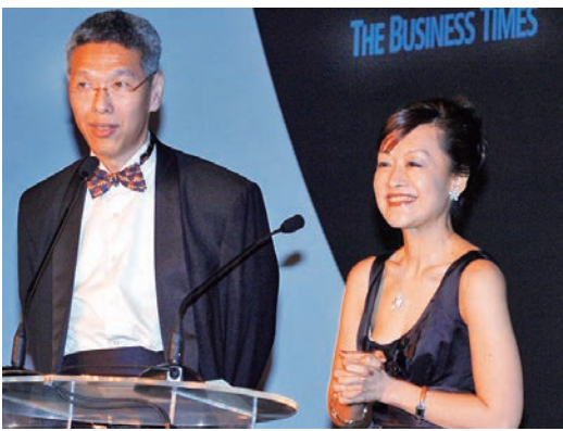
▲李顯龍弟弟李顯揚與妻子林學芬