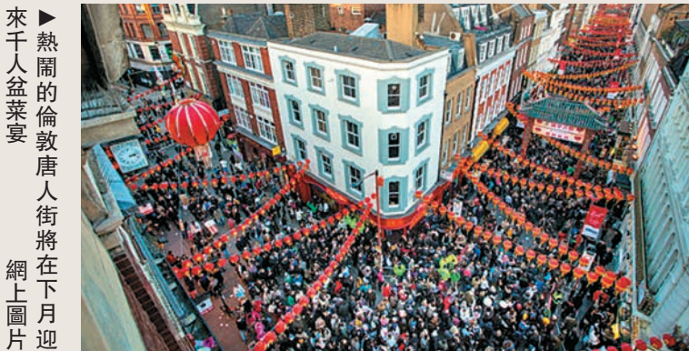
►熱鬧的倫敦唐人街將在下月迎來千人盆菜宴