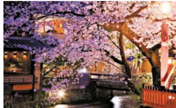
▲京都賞櫻深受遊客歡迎

過多遊客的到訪影響到了居民的日常生活，一些遊客甚至跑到當地民居的玄關處拍照，引發雙方衝突。當地居民的不滿情緒愈加嚴重，紛紛發出「這樣下去真的好嗎」的質問。