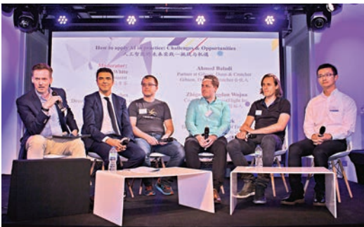
▲嘉賓在科技節上討論人工智能

本次科技節共發布七項合作成果，英國大使投資協會行政總裁詹妮評價稱，這是中英所達成的真正合作，是兩國關係快速發展的體現。