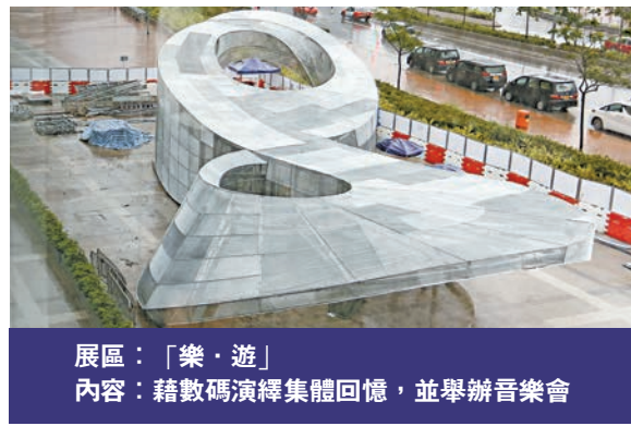
展區：「樂·遊」 內容：藉數碼演繹集體回憶，並舉辦音樂會