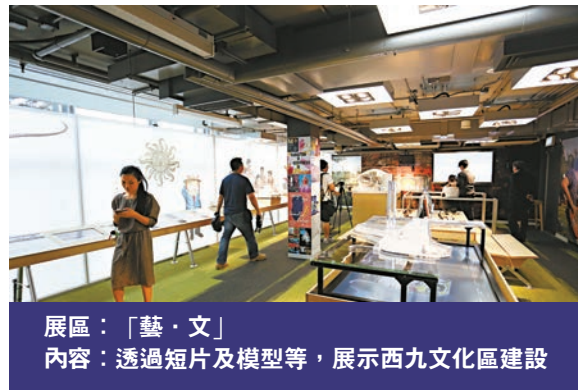
展區：「藝·文」 內容：透過短片及模型等，展示西九文化區建設