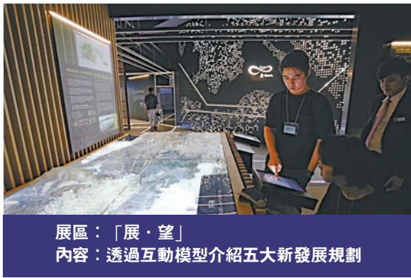
展區：「展·望」 內容：透過互動模型介紹五大新發展規劃