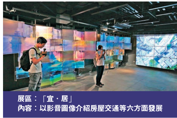
展區：「宜·居」 內容：以影音圖像介紹房屋交通等六方面發展