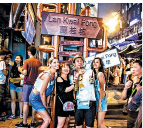
▲「蘭桂坊音樂啤酒節2017」今年以「熱帶綠洲」為主題