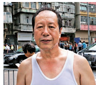
▲陳先生憶述事件時猶有餘悸

「如果杯入多一呎，我就瓜得喇！」紅磡唐樓露台「甩底」，半張碌架床懸浮半空，直如滑梯，睡在碌架床下格、65歲的陳先生劫後餘生，猶有餘悸說：「梗係驚啦！邊個都驚，神仙都驚啦！」