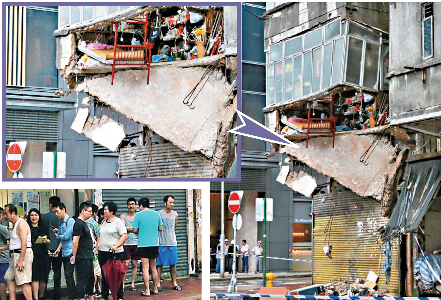
◀紅磡唐樓昨發生罕露意外，房內碌架床「穿底」，石屎地板「吊吊掙」