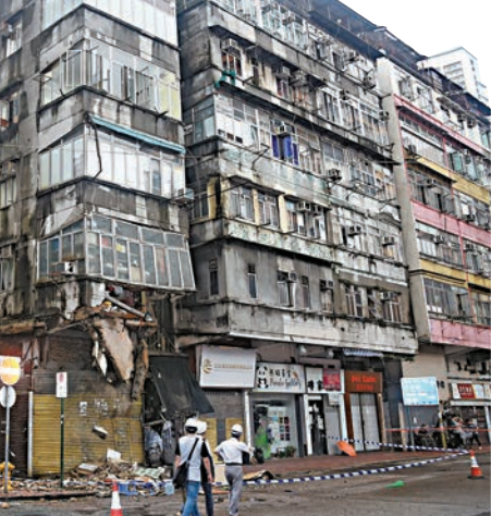
▶發生罕露台的舊樓存在現場一帶相同的舊樓存在

昨日現場同區的馬頭圍道一幢55年樓齡五層高舊唐樓，於2010年1月29日在15秒內倒塌，活埋五住客，釀成四死兩傷。