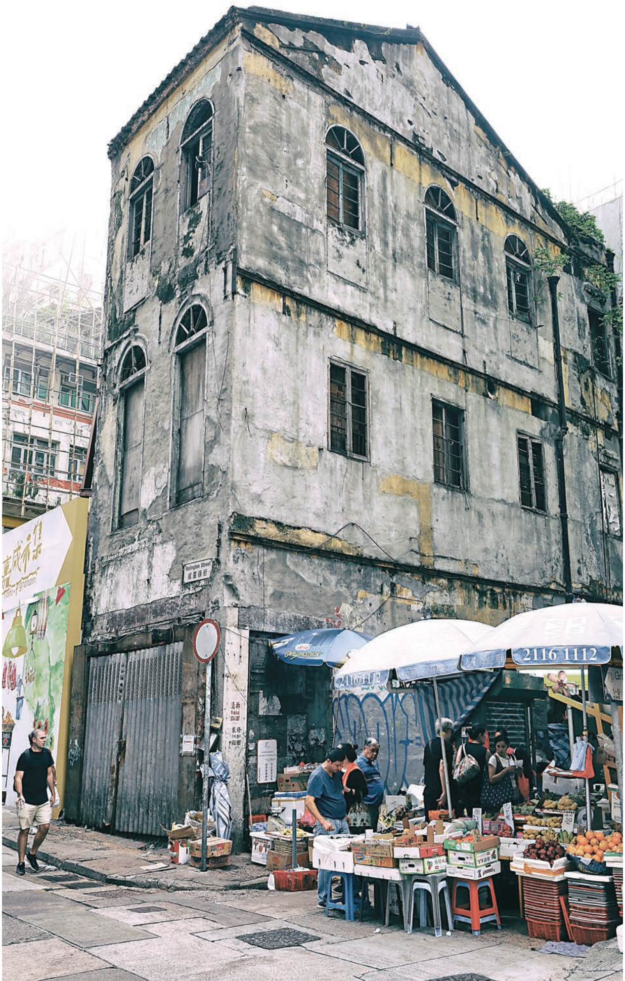
▲唐樓是上一代港人的集體回憶，由香港開埠初期計起，港式唐樓共分四代，直至上世紀60年代後，才逐漸退出歷史舞台。圖為第一代現存唐樓「永和號」

「背靠背」唐樓逐漸消失，源於1894年一場瘟疫，當時，華人聚居的太平山街一帶爆發大規模鼠疫，逾2000人死亡，香港宣布為疫埠。港英政府為阻疫症蔓延，清拆太平山街一帶的華人住宅，驅趕7000名居民，又認定「背靠背」唐樓是造成疫症成因，於是在1903年頒令禁止興建「背靠背」唐樓。