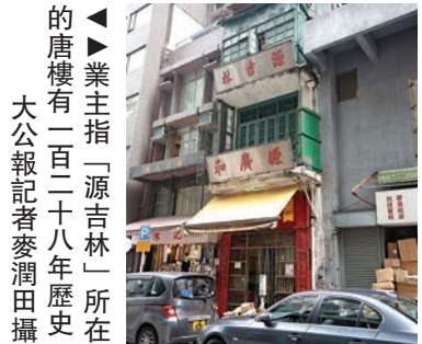
▲業主指「源吉林」所在唐樓有一百二十八年歷史