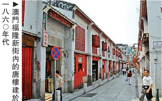
一八六〇年代澳門福隆新街內的唐樓建於

前舖後居以外，「騎樓」是唐樓另一大設計特色。「騎樓」以磚柱支撐，上層建築跨出行人路，住宅空間擴大，同時也為樓下行人避風擋雨，這種建築風格不但盛行於近代香港、澳門及廣州等華南地區，遠至東南亞華人社區如馬來西亞檳城及新加坡，也有「騎樓」蹤影，星馬的人把它稱為「店屋」。