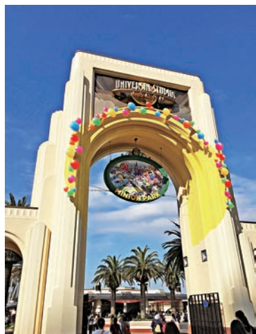
▲ 環球影城的入口現以「迷你兵樂園」作招徠