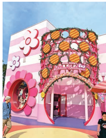
▲ Hello Kitty 城堡以粉紅色作主調，賣萌指數爆燈