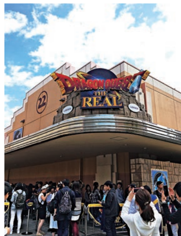
▲ Cool Japan 排隊時間最長的項目便是「勇者鬥惡龍」