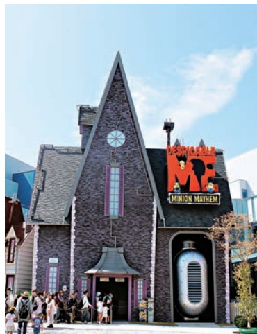
▲ 遊客排隊進入這幢實驗室大樓，準備參加「迷你兵瘋狂乘車遊」