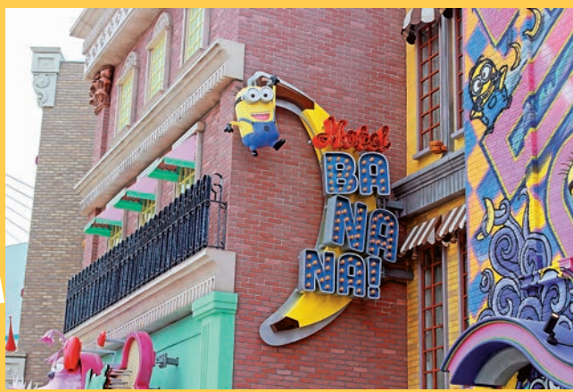
▲ 一個迷你兵掛在商場外，向遊客say hello