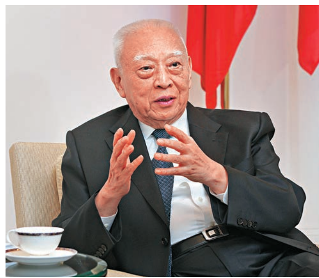
▲董建華指中央幾次對基本法進行釋法都是為香港好

董建華又表示，中央基本上不會干涉香港具體事務，但中央最緊張國家安全和主權問題，不要出現「港獨」等影響國家對香港主權的事。他強調，雖然香港社會的確有人推動「港獨」，但猶幸支持這種主張的人只有很少。