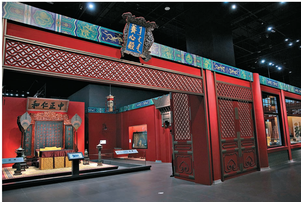
▲「正殿明間」正中展出的牌匾「中正仁和」是雍正皇帝親筆所寫

為慶祝香港回歸20周年，八代清帝的「家居辦公室」養心殿首次「出境」，今日起在沙田文化博物館展出，成人門票僅20元。是次「八代帝居——故宮養心殿文物展」耗資2000萬元打造，共有236件來自北京故宮博物院的展品，預計逾10萬人次入場。展覽以原狀陳列，一比一還原養心殿原貌，更搭建了模擬「三希堂」，參觀者可走入「乾隆的文藝小宇宙」，體驗昔日皇帝帝餘休憩賞玩的好時光！更不能錯過收集八位皇帝，批閱奏摺時「知道了」的簽名印章。