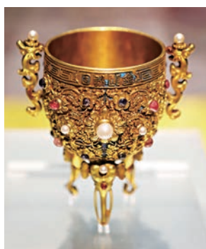
▲全球僅有四件的金嵌珠寶「金甌永固」杯