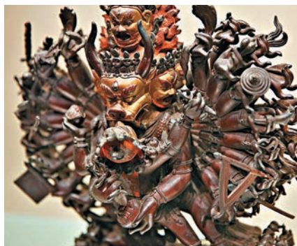
▲清室篤信藏傳佛教，圖為養心殿內的佛像