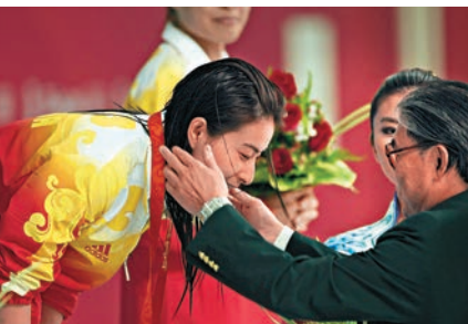
▲霍震霆（右）於北京奧運親自頒獎予郭晶晶

霍震霆在接受《大公報》專訪時指出，體育以往於普羅大眾眼中，只是可有可無的玩意，其發展向來未受重視，但在回歸後，政府積極推動體育發展，加上背靠祖國的優勢，香港運動員和從事運動培訓的教練，都獲得更多參賽、訓練和人員交流的機會，令香港體育得以飛躍發展。香港健兒在回歸後可以參加全國運動會，霍震霆認為那是值得高興的事。從單車名將黃金寶於1997年的全運會勇摘金牌開始，香港體壇發展踏入輝煌時代。乒壇「孖寶」李靜、高禮澤在2004年雅典奧運勇摘男雙銀牌、場地單車的李慧詩於2012年倫敦奧運凱琳賽勇奪銅牌。他們凱旋返港時均受到熱烈歡迎，社會洋溢著歡樂氣氛，這些健兒更成為了年輕人奮發向上的榜樣。