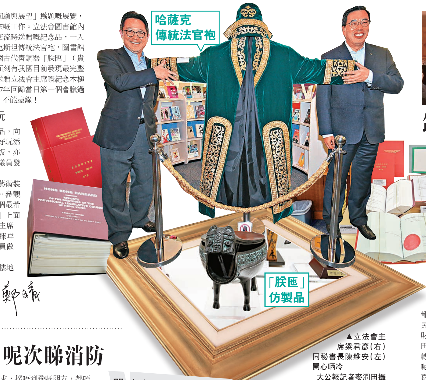
哈薩克傳統法官袍

今次展覽嘅立法會綜合大樓地下大堂及圖書館展出，展期去到7月31日，有興趣嘅朋友可以去立法會登記，或者參加立法會教育導賞團㗎！