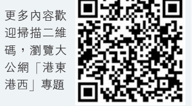
更多內容歡迎掃描二維碼，瀏覽大公網「港東港西」專題