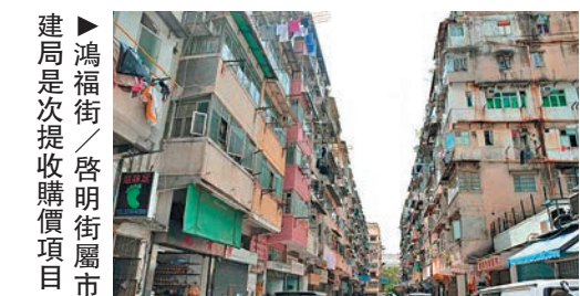
建局是次提出收購價項目

【大公報訊】記者曾敏捷報道：市區重建局決定以歷來最高收購價，向土瓜灣三個重建項目，包括庇利街／榮光街發展項目、鴻福街／啓明街發展項目、榮光街發展項目，提出收購建議，每平方呎實用面積收購價高達15383元，刷新兩年前的最高收購價紀錄，與市建局去年六月在同區春田街／崇志街項目提出的收購價比較，一年多已上升近36%。