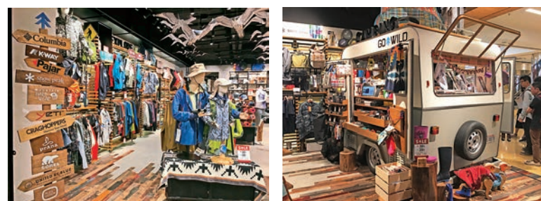
▲太古旗下運動服飾零售店一站式野遊裝備專門店「GO WILD」

當然，這只是一段野史，太古集團的官方解釋，「太古」寓意「規模宏大，歷史悠久」，由時任英國駐上海領事梅多斯在太古洋行於上海開業時，特意為公司所取。