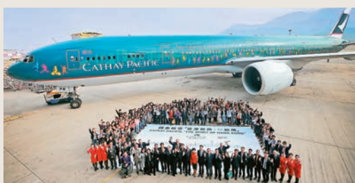
▶國泰曾於1997年將一架波音客機上特別塗裝，命名「香港精神號」