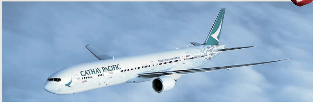
▲為慶祝香港回歸20周年，國泰以傳統的雲彩和洋紫荊花為題材，創造新一代「香港精神號」