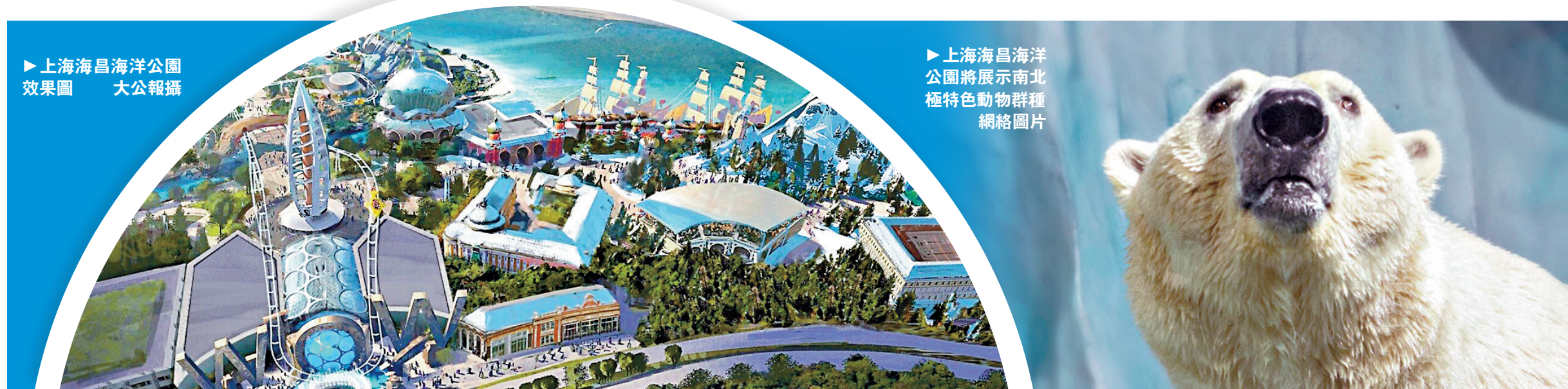
►上海海昌海洋公園將展示南北極特色動物群種