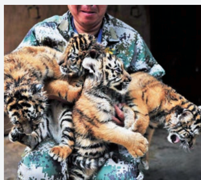
▲飼養員懷中的東北虎寶寶

福建、安徽的衆多觀鳥者認爲，合福高鐵沿線黃金觀鳥帶已初步形成，未來發展「一片光明」。(新華社)