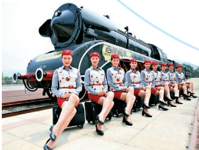
▼四川高校學生在火車前擺造型

此次，上海海昌海洋公園主體結構封頂，則意味着項目推進取得階段性重大進展，據透露，後續集團將加速推進上海項目的建設開發及籌備，「以確保於2018年暑期開業」。其實，上海目前已有滬迪園、天文館等多個已建或