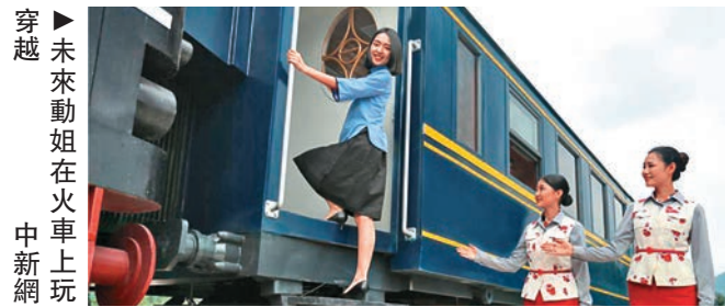
►未來動姐在火車上玩穿越 中新網