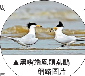
▲黑嘴端風頭燕鷗

合福高鐵被譽爲中國「最美高鐵線」，沿線不僅有美麗的風景，也有衆多珍貴鳥種。從2015年6月開通以來，便成爲了衆多沿線觀鳥愛好者的新選擇。三年來，沿合福高鐵觀鳥的中外