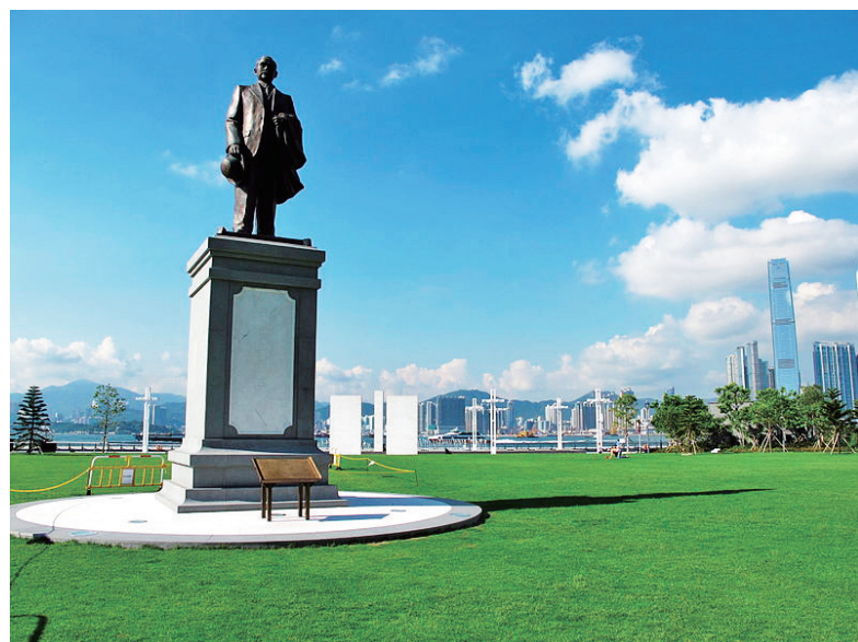
▲香港中山紀念公園的孫中山像