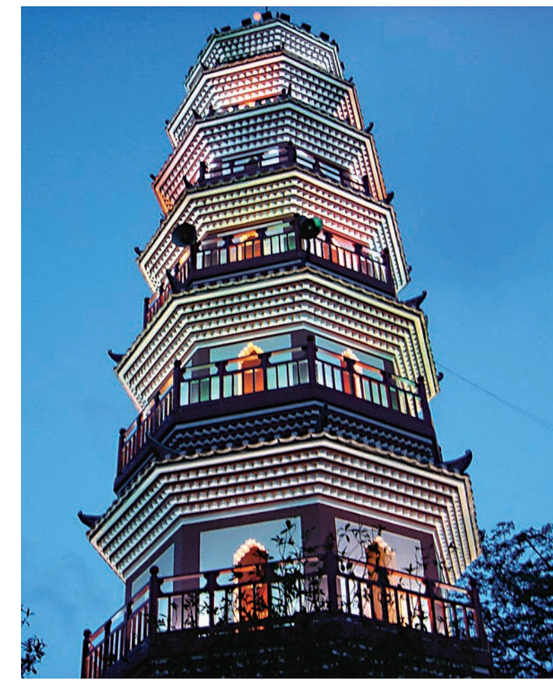
▲中山十景之阜峰文筆——煙墩山塔

香港藝術學院的學生將到中山等地交流；七月十日，香港中聯辦以獻禮香港回歸祖國二十周年為契機，將與中山市政協共同啓動「粵港澳大灣區文化行」暨「香港與中山」系列文化活動。一首將由香港中聯辦與中山市政協共同合作的規模更宏大、用「文化」為橋演唱出來《香港是我家》的大歌將盛大唱響。