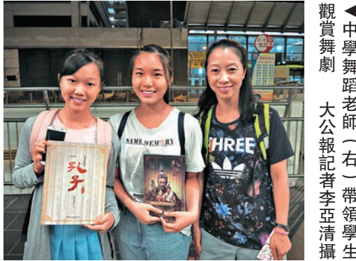
▲中學舞蹈老師（右）帶領學生觀賞舞劇