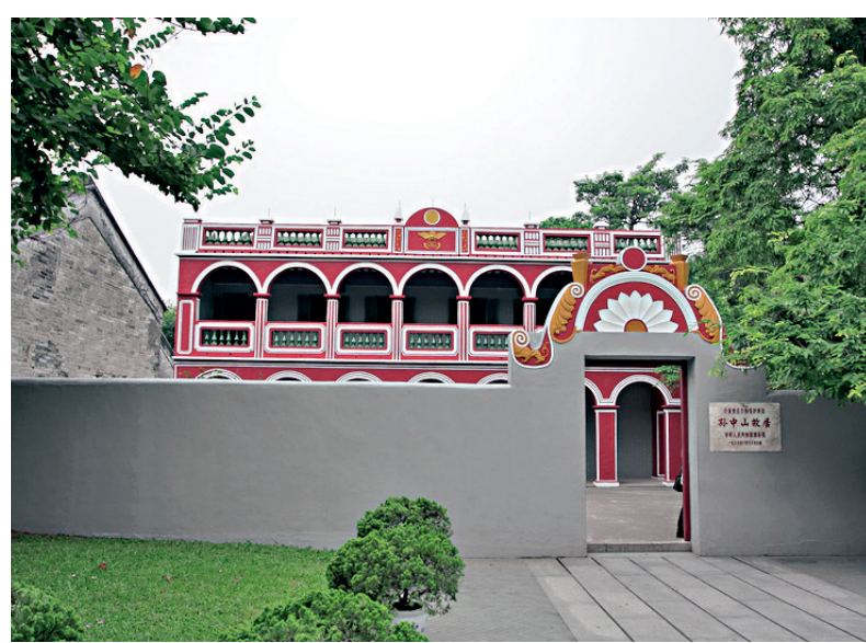
▲孫中山在中山市翠亨村住所舊址

香港藝術學院的學生將到中山等地交流；七月十日，香港中聯辦以獻禮香港回歸祖國二十周年為契機，將與中山市政協共同啓動「粵港澳大灣區文化行」暨「香港與中山」系列文化活動。一首將由香港中聯辦與中山市政協共同合作的規模更宏大、用「文化」為橋演唱出來《香港是我家》的大歌將盛大唱響。