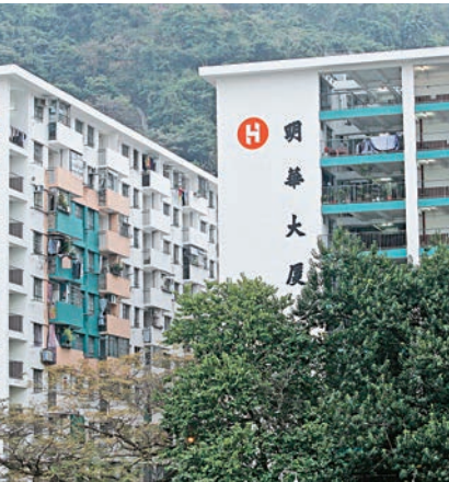
▲重建前的明華大廈