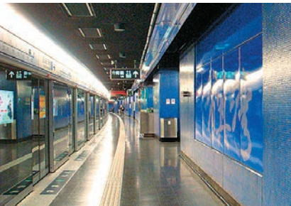
▲明華大廈鄰近港鐵筲箕灣站