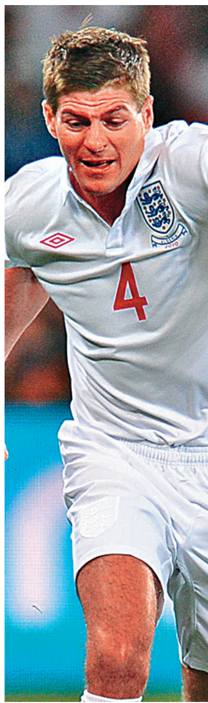
▲謝拉特在利物浦有「神奇隊長」稱號