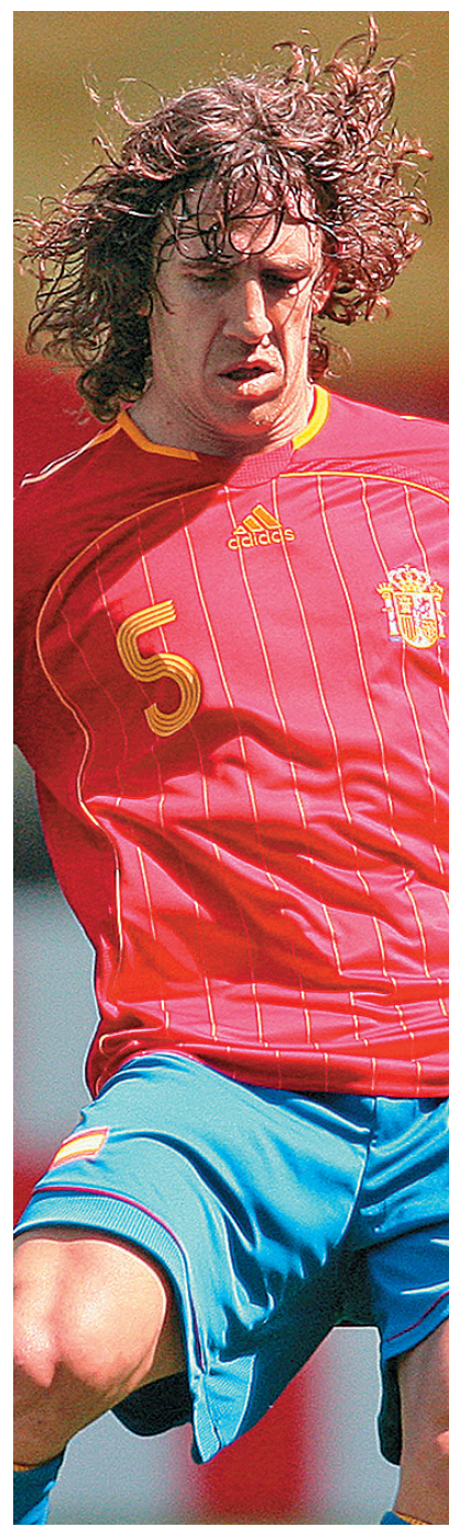
▲佩奧爾於2010年助西班牙捧走世界杯

由商業機構主辦的首屆Star Sixes賽事，邀請了12支球隊分三組比賽，A組有東道主英格蘭、西班牙、蘇格蘭及墨西哥；B組有中國、巴西、意大利及尼日利亞；C組有德國、法國、葡萄牙及丹麥。每組首兩名及兩支成績最好的第三名球隊將出線八強，再進行淘汰賽直至決出冠軍。分組賽每場比賽時間為20分鐘，八強至決賽每場則分上、下半場各15分鐘，中場有短暫休息時間，淘汰階段打和即互射「極刑」決勝負。球例大致上跟11人賽相