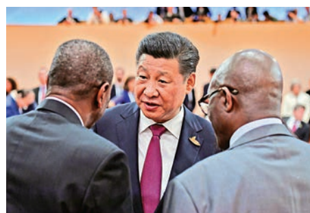
▲中國國家主席習近平與南非總統祖馬（右）和非洲輪值主席、幾內亞總統孔戴交談

成果的期待，朱光耀強調，中國對於G20的政策形成的原則是，所有政策必須建立在G20所有成員達成共識的基礎之上，「不能排除任何一個成員」。