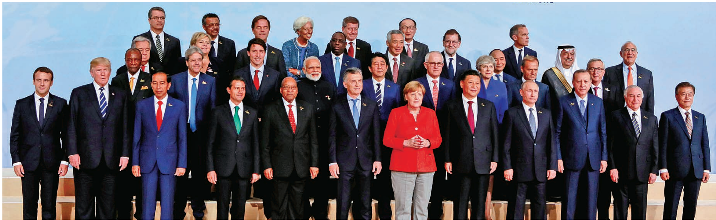
德國漢堡G20峰會與會領袖和代表拍攝大合照