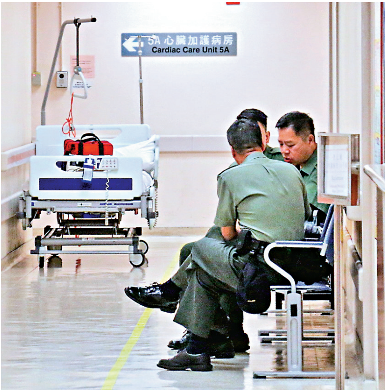
►懲教署人員在深切治療病房外看守