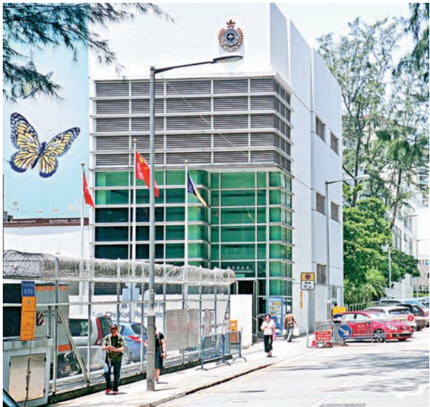
▲荔枝角收押所內昨晨有犯人上吊自殺

現場消息稱，昨日清潔活動，疑犯洗床單時偷取一張床單，再走入活動室內的廁所上吊，懲教人員發現他良久未離開廁所，入內查看揭發有人吊頸。據報現場留有遺書，透露有輕生念頭。 懲教署發言人表示，昨晨八時，荔枝角收押所懲教人員，制止一名28歲男性選擇在囚人士上吊自殺。人員當時發現該名