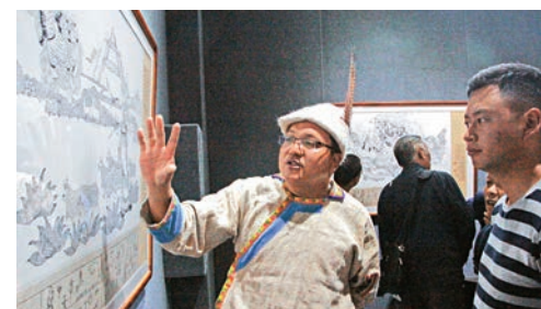
▲現場人員為來賓介紹《黑白戰爭》連環畫故事情節

京成功展出後，《納西族史詩《黑白戰爭》連環畫展》7月8日起在雲南昆明市博物館展出。展覽以65幅連環畫的形式，對納西族東巴經書《董埃術埃》（又名《黑白戰爭》）進行了再創作，通過展現現代納西部落為爭奪日月星辰而展開的浩大而頻繁的戰爭場面，歌頌了主角格拉茨姆和董若瓦路一對青年男女的生死戀情。（記者 和向紅）