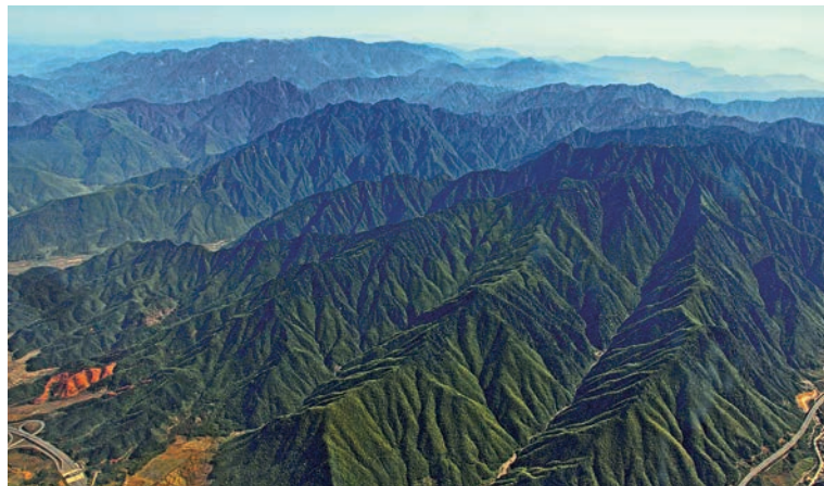
▲航拍江西鉛山縣境內的武夷山脈