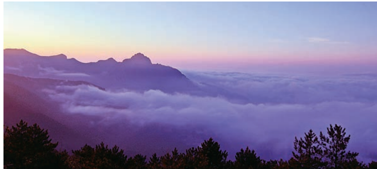
▲雲霧繚繞的武夷山