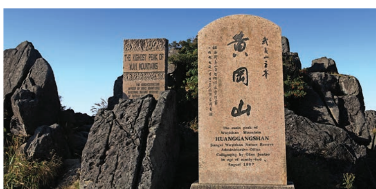
▲東南大陸第一峰、華東屋脊、武夷山主峰——黃崗山