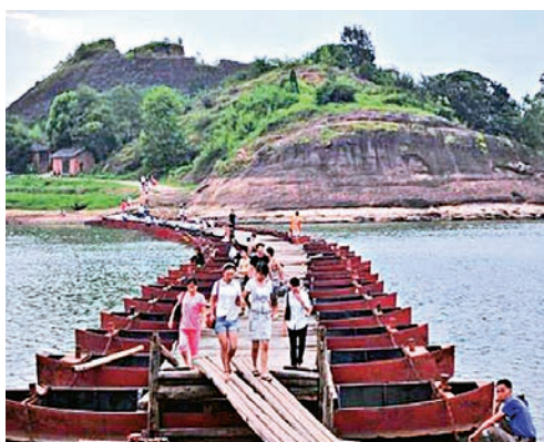
▲遊客在江西鉛山百年浮橋上暢遊 網絡圖片