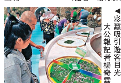
▲彩蠶吸引遊客目光

六園一區」，給人以全新的視角。其中，蠶桑科技和生產活動的展示，是此次農業嘉年華最耀眼的風景。不同品種的蠶，不同生長時期蠶寶寶，從幼卵到化蛹成蝶的整個過程在此完美呈現。（記者 楊奇霖）