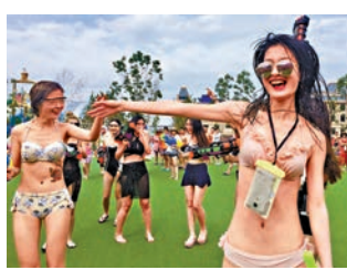
▲比堅尼美女盡情釋放盛夏激情

絢麗舞台、性感比堅尼美女、互動潑水大戰、炫目燈光秀、饕餮啤酒美食節完美融合，來自俄羅斯、澳洲、坦桑尼亞的著