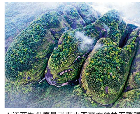
▲江西撫州廣昌武夷山西麓在航拍下驚現「情侶鞋」 網絡圖片