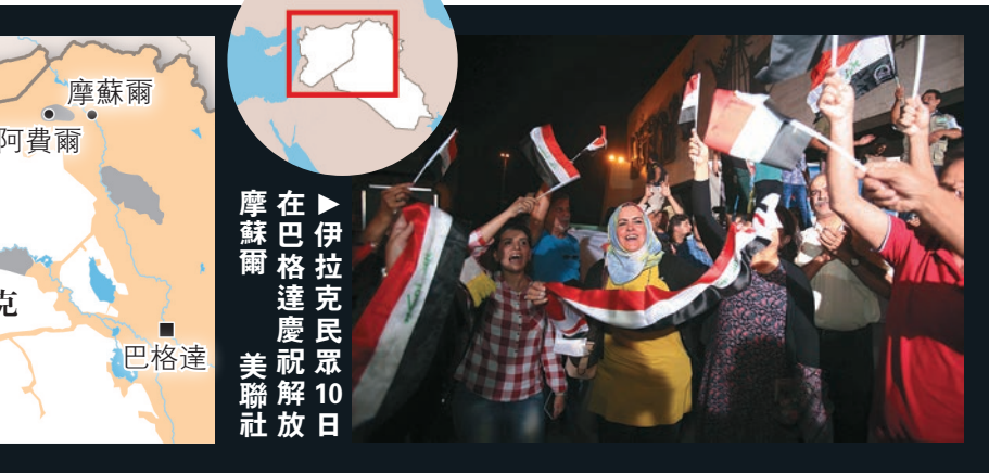
在伊拉克克摩蘇爾