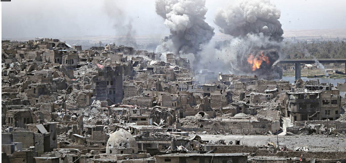
▲伊拉克摩蘇爾的ISIS據點11日繼續被空襲

【大公報訊】綜合法新社、路透社、新華社、英國廣播公司報道：伊拉克媒體11日報道，極端組織「伊斯蘭國」(ISIS)周二終於承認，該組織最高頭目、綽號為「鬼魂」的阿布·貝克爾·巴格達迪已經死亡，並稱將在不久之後產生新頭目。此前，伊拉克政府10日正式宣布完全收復ISIS「建國」首都摩蘇爾，巴格達迪的死訊將進一步打擊ISIS。伊拉克當地的的美軍將領則表示，戰事尚未結束，須警惕ISIS2.0崛起。