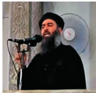
▲2014年，ISIS領導人巴格達迪在摩蘇爾宣布「建國」路透社

【大公報訊】綜合法新社、路透社、新華社、英國廣播公司報道：伊拉克媒體11日報道，極端組織「伊斯蘭國」(ISIS)周二終於承認，該組織最高頭目、綽號為「鬼魂」的阿布·貝克爾·巴格達迪已經死亡，並稱將在不久之後產生新頭目。此前，伊拉克政府10日正式宣布完全收復ISIS「建國」首都摩蘇爾，巴格達迪的死訊將進一步打擊ISIS。伊拉克當地的的美軍將領則表示，戰事尚未結束，須警惕ISIS2.0崛起。