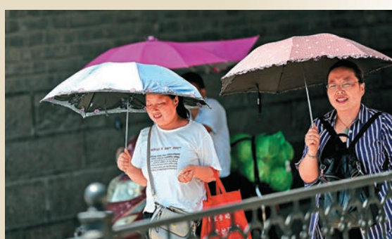
西安 ▲西安民眾在烈日下出行