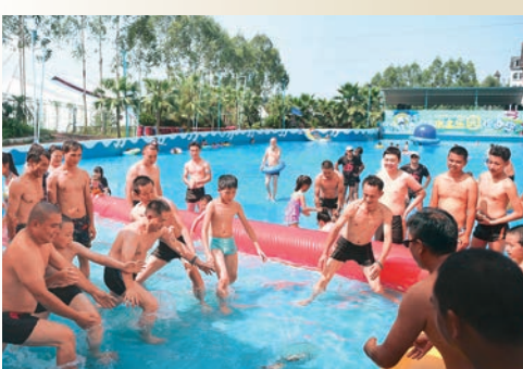
重慶 ▲遊客在重慶一水上樂園內戲水納涼