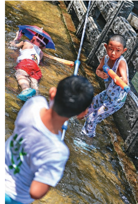
濟南 ▲濟南兒童在水池戲水納涼