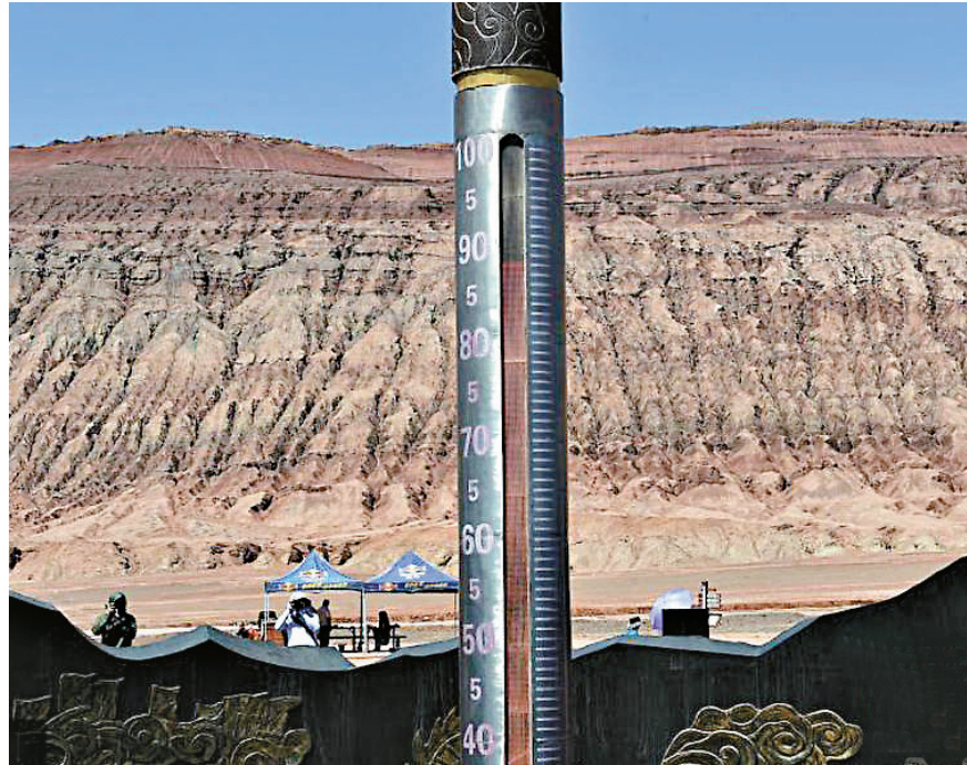
吐魯番 ▲7月9日，新疆吐魯番持續出現高溫天氣，最高氣溫達48攝氏度，地表高達88攝氏度

濟南的網友@米西米西小麗醬也表示，「濟南彷彿在下火，那種感覺就像站在空調外機前面，用十倍馬力烘着你。」