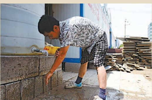
太原 ▲工地工人停止戶外作業，在泳池邊洗手

近期，高溫成為中國北方天氣舞台上的一個重要角色，從西北至華北、黃淮等地均陸續受到高溫「烤驗」。其中新疆吐魯番7月10日氣溫高達49°C，吐魯番二堡鄉氣溫更是突破50°C。據最新氣象預報，未來10天，中國中東部地區將迎來今年範圍最廣、強度最強高溫天氣，最強時段，預計全國高溫面積可達364萬平方公里，將覆蓋21個省份。