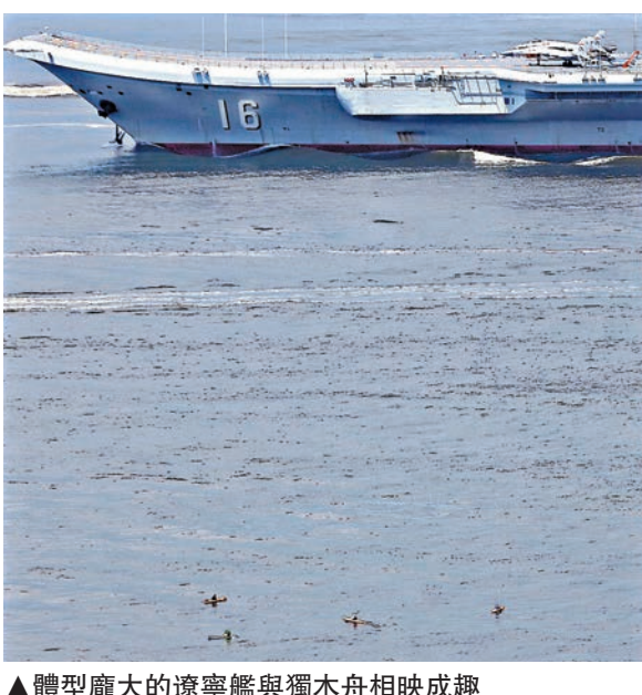
▲體型龐大的遼寧艦與獨木舟相映成趣

昨日的昂船洲軍營海風徐徐，銀川艦、煙台艦、濟南艦三艘遼寧艦屬艦在陽光下熠熠生輝。參加歡送儀式的市民掛出「歡迎遼寧艦再次來港」、「文明之師 威武之師」的橫幅，揮舞國旗和區旗為遼寧艦編隊送行。