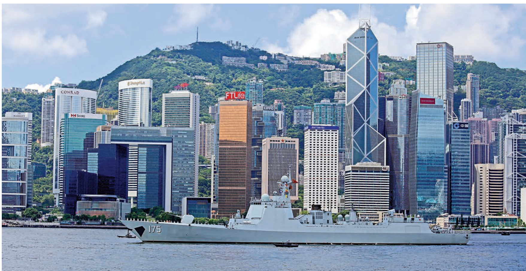
▲銀川艦離港時駛經政府總部