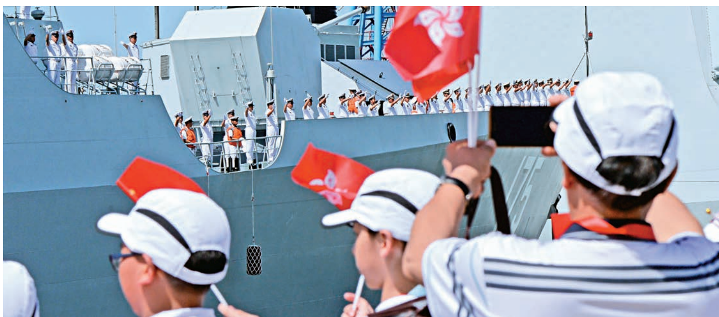
▲市民揮舞國旗和區旗歡送屬艦官兵，甲板上的官兵亦向碼頭上的市民揮手道別