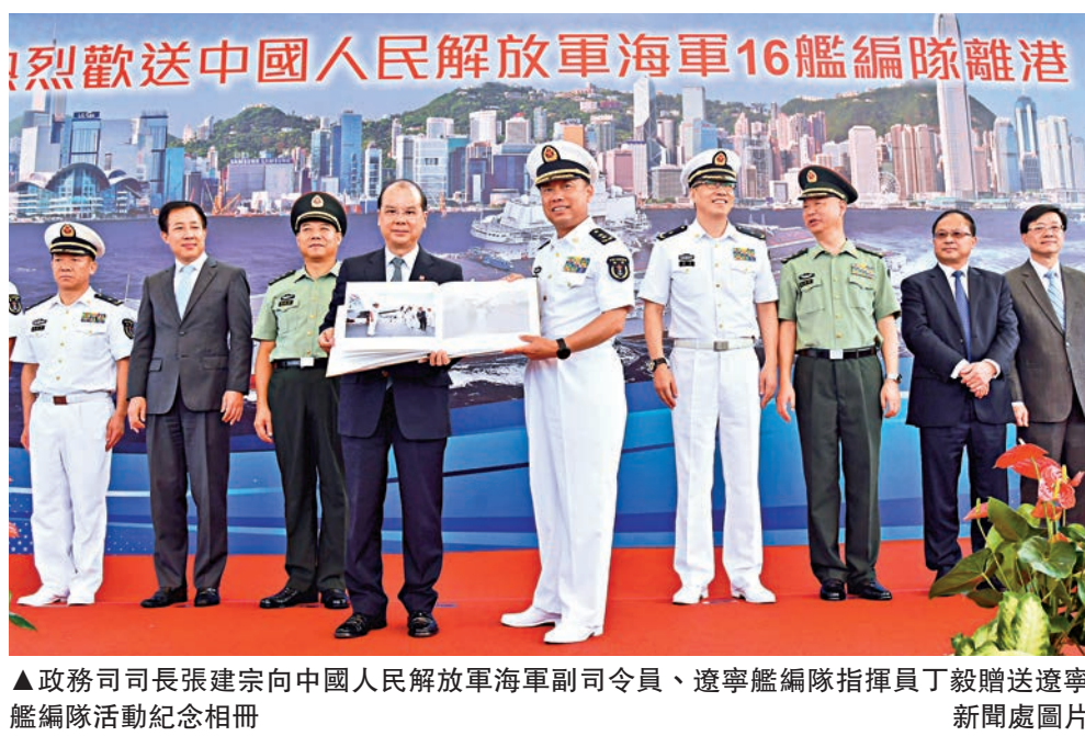
▲政務司司長張建宗向中國人民解放軍海軍副司令員、遼寧艦編隊指揮員丁毅贈送遼寧艦編隊活動紀念冊