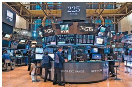
▲美股周二造好，道指曾升26點