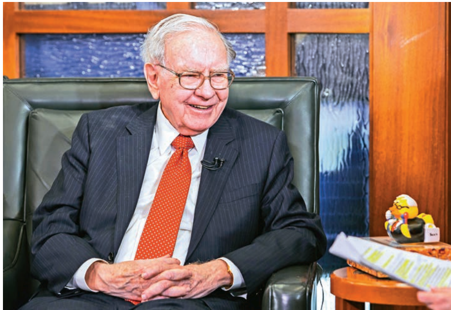
▲巴菲特周一表示，計劃安排財產後的十年期間，透過年度捐贈方式，把所持的巴郡股票，悉數贈予慈善機構

另外，巴菲特計劃購買美國輸電公司Oncor出現競爭對手。巴郡上周五宣布上述收購消息，而該宗交易估值達180億美元，然而，外報周二報道，對沖基金