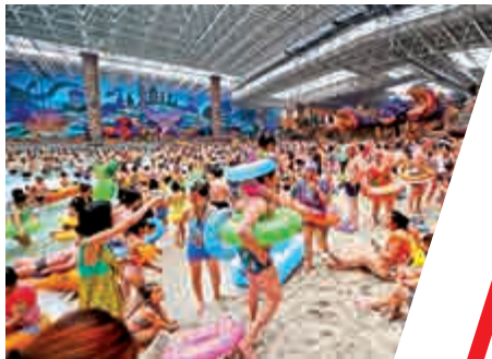
▲黑龍江市民在水上樂園戲水 覓清涼