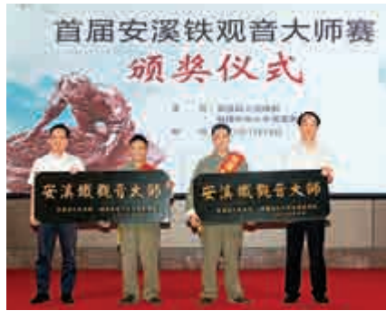
▲當地官方兩名勝出者授予「鐵觀音大師」稱號