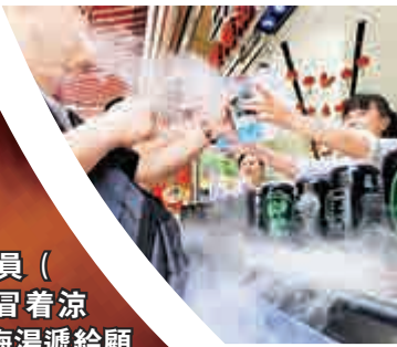
►售貨員（右）將冒着涼氣的酸梅湯遞給顧客

石家莊一家大型連鎖超市裏，所剩不多的綠豆依然被五六名民眾圍着裝袋。超市工作人員介紹，高溫天氣時，白天客流量明顯減少，十