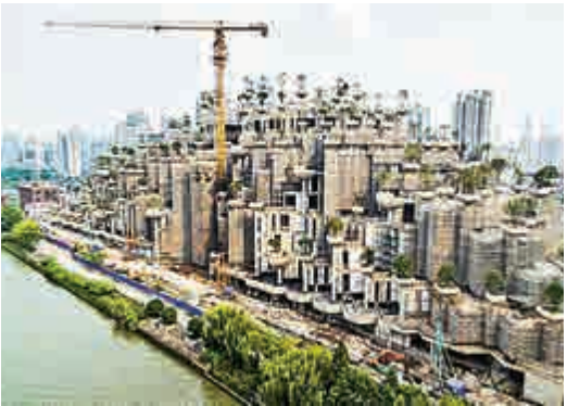
▲「空中花園」看似鬧市中的一座鬱鬱蔥蔥的山丘