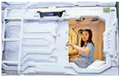
▲上海市民試睡共享床鋪

但不少人卻對共享睡眠的床鋪衛生感到擔憂，怕封閉的艙體內會留有異味等問題。對此，運營方表示，提供睡眠的艙具都是一次性，且在上一個住戶結束入住後，艙內會自動進行紫外線消毒。（記者 孔雯瓊）