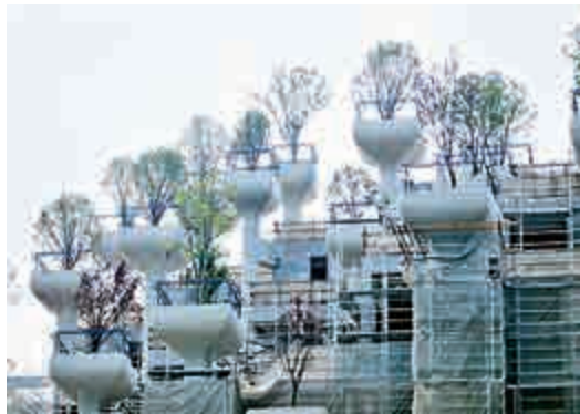
▲「空中花園」頂部高度不一的承台上種滿各種綠色植物 網絡圖片

據悉，該建築在Heatherwick工作室的官方名字叫「1000 trees（1000棵樹）」，預計在2018年完工。（快科技）