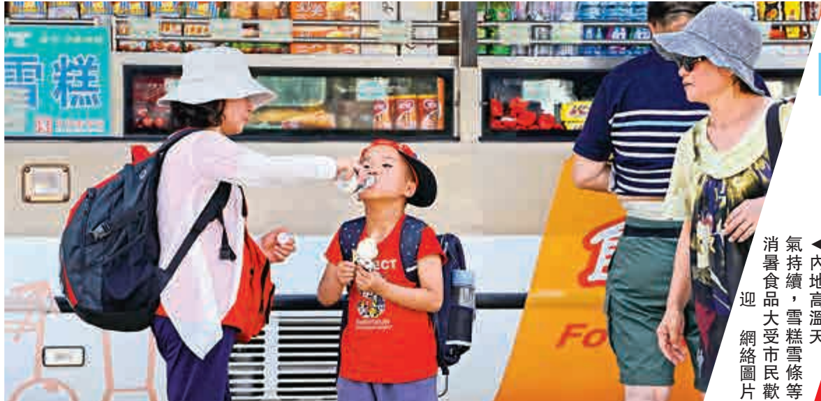
氣持續，雪糕雪條等消暑食品大受市民歡迎

幾個收銀通道，白天一般只有五六個在服務；不過一到晚上，客流量就明顯上升，即使將收銀通道全部打開，還是會出現顧客排隊等候的情況。