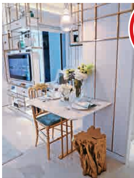
▲飯廳置放一張天然石紋圖案餐桌