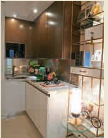
▲百子櫃式櫃桶與層架,置放於開放式廚房隔鄰