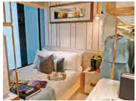
▲主人睡房方正實用

另開放式廚房配備德國品牌Miele系列入廚電器;浴室配備Kohler潔具及意大利