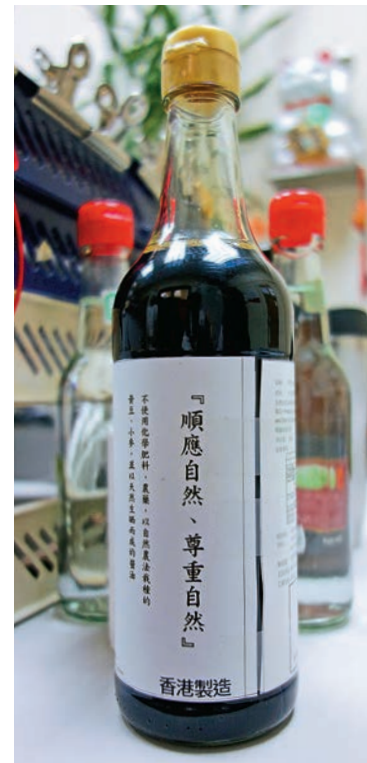
▲悅和堅持傳統天然生曬釀製

「我們老闊希望保留醬油最傳統的製法，天然生曬，自然發酵，盡量把害處減到最低。我們堅持傳統方法，但堅持傳統不代表古舊。」廠長指着最新引入的玻璃缸說：「這種玻璃缸不會阻隔陽光，可以把黃豆曬得有光澤，而且衛生好，烏蠅蚊蟲根本無法進去。我們依然會像用甕缸釀製醬油一樣，至少天然生曬半年以上，現在的醬油因為用化學品兩個星期就造好了，我們不會這樣做。」