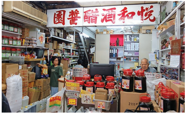
▲走入荃灣悅和老舖門市，彷彿時光倒流到人情味濃的年代