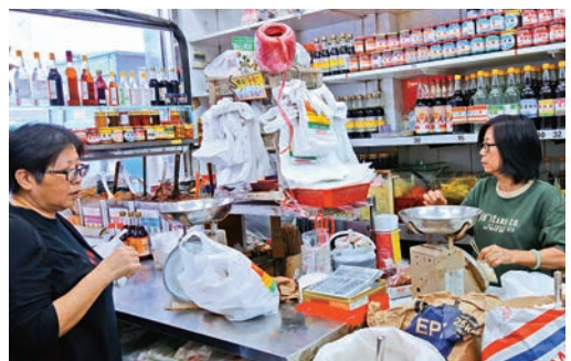
▲街坊到老舖買醬油，打牙駱是「指定動作」

「哎呀，她走去哪裏了，她還沒拿東西呢！」店員的叫聲打斷了老闆的話語，她一邊說一邊追了出去，最後把八塊錢的白糖，送到了客人手上，我們笑逐顏開，老闆打趣地說：「以前我們用家裏的碗去買醬油，一定不會忘記拿。」