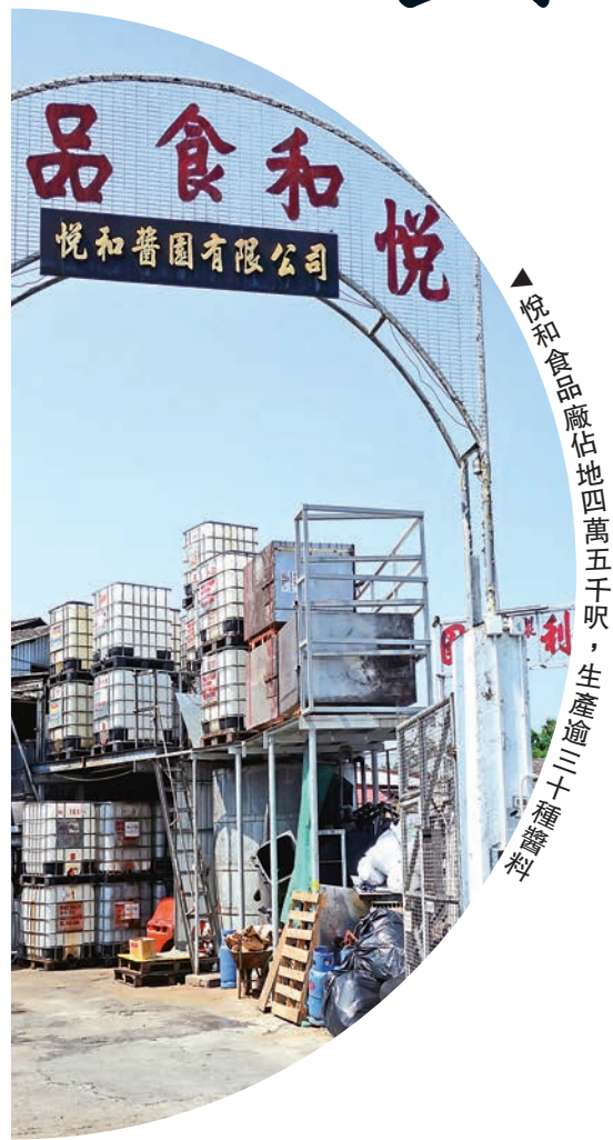
▲悅和食品廠佔地四萬五千呎，生產逾三十種醬料