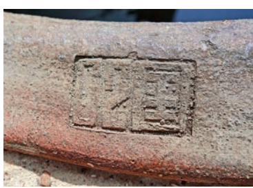
▲部分悅和甕缸屬民國時期產物，擁有70年歷史