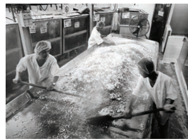
▲昔日的悅和廠房工人工作情況