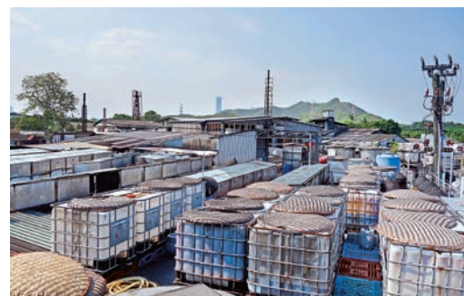
▲新界東北將有另一番景象

新發展區於建成後，可以提供59900個住宅單位(約六成單位為公共屋邨，佔住宅用地25%)，為172300人提供居所。新界東北發展計劃於2017年啓動，於2022年讓第一批人口遷入居住，並於2031年完成所有工程。悅和醬園廠因新界東北發展計劃，面臨拆遷的命運。