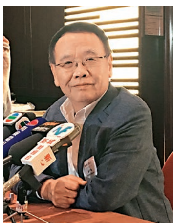
◀百麗國際首席執行官李潔儀攝