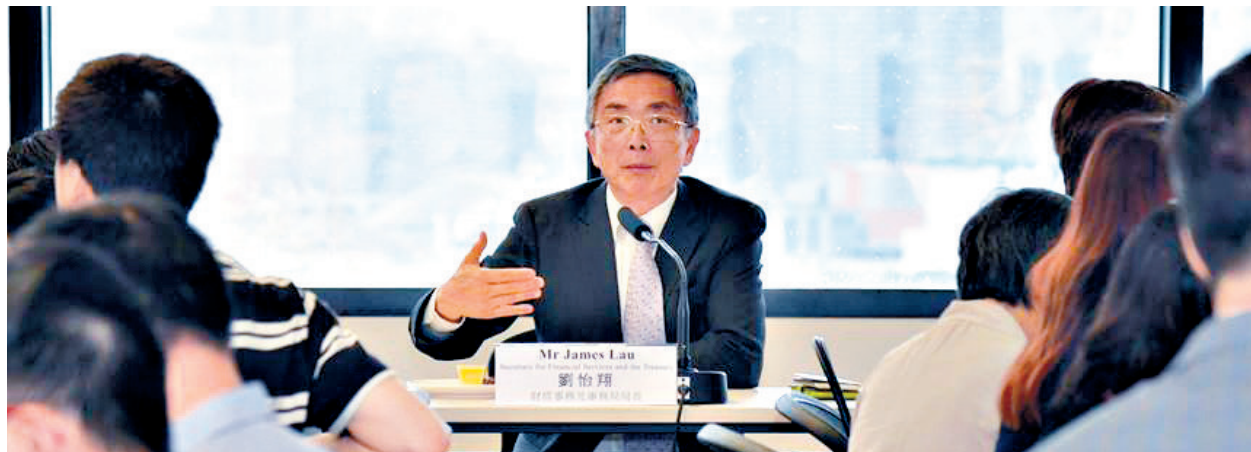
◀新任財經事務及庫務局局長劉怡翔表示，希望香港能建立一個中央個人資料庫

去年，金發局亦爲香港發展綠色金融提出建議，包括由受政府和公營機構管控的發行人發行基準「綠色債券」；成立綠色金融諮詢委員會或同類機構，以制定長遠工作重點及提供協助；舉辦有關綠色金融及投資的全球會議，以及一系列的座談會；借助大學和專業團體培育綠色金融人才，確保人才供應；以及爲綠色金融項目和證券設立「綠色金融標籤計劃」，從而吸引新發行人和新投資者來港。