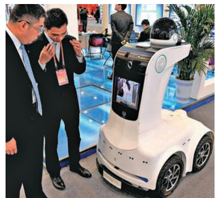
▲年初河南鄭州國際投資貿易洽談會上展出多種高科技產品 資料圖片

。三是提高科技型中小企業研發費用稅前加計扣除比例，由50%提高至75%。四是對創業投資企業和天使投資個人，