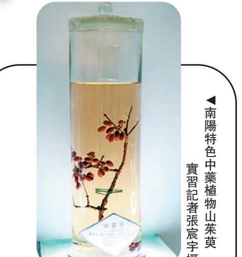
▲南陽特色中藥植物山茱萸