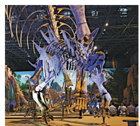
▲恐龍遺跡園展出的大型恐龍骨架

【大公報訊】實習記者李寅舟、朱映霖南陽報道：秦嶺之東，伏牛之南，西峽目前出土了世界上最多數量和種類恐龍蛋化石。