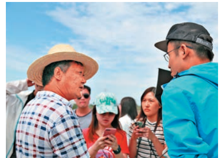
▲港傳媒學子採訪南水北調渠首大壩管理人員

據悉，除了辛勤工作、力保水源安全的「守壩人」們，南水北調中線幹線還設置有64個節制閘、60個控制閘、95個分水閘以及54個退水閘，一旦發生突發污染情況，可以分段關閉閘門，通過退水閘將渠道內的污水排出，避免「問題水」北上。