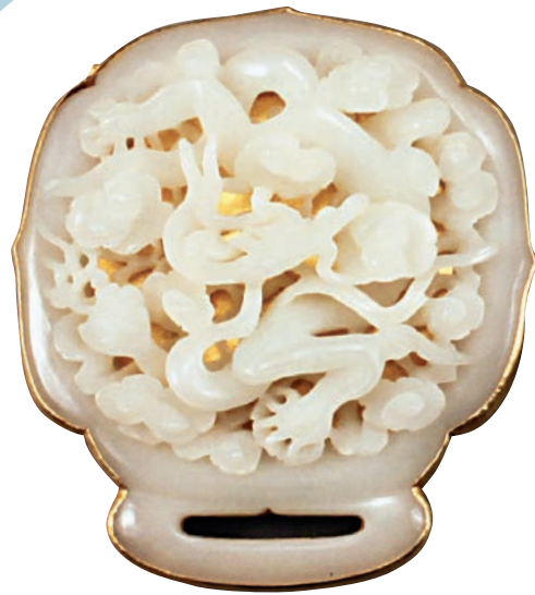
▲明代鑲金托雲龍紋玉帶板