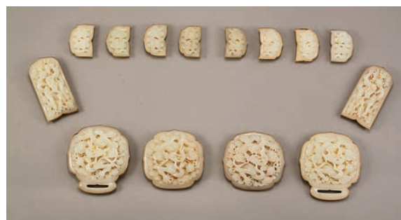
▲明代鑲金托雲龍紋玉帶

明代洪武二年（一三六九年），朝廷在景德鎮設置御窯廠，匯集全國最優秀的瓷匠，壟斷優質的製瓷原料和燒瓷燃料，不惜工本，燒造出大量至精至美的官窯產品。