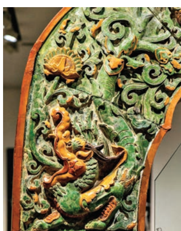
▲大報恩寺琉璃塔琉璃構件