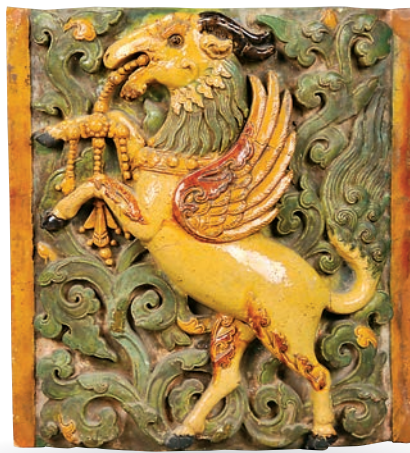
▲飛羊紋琉璃磚