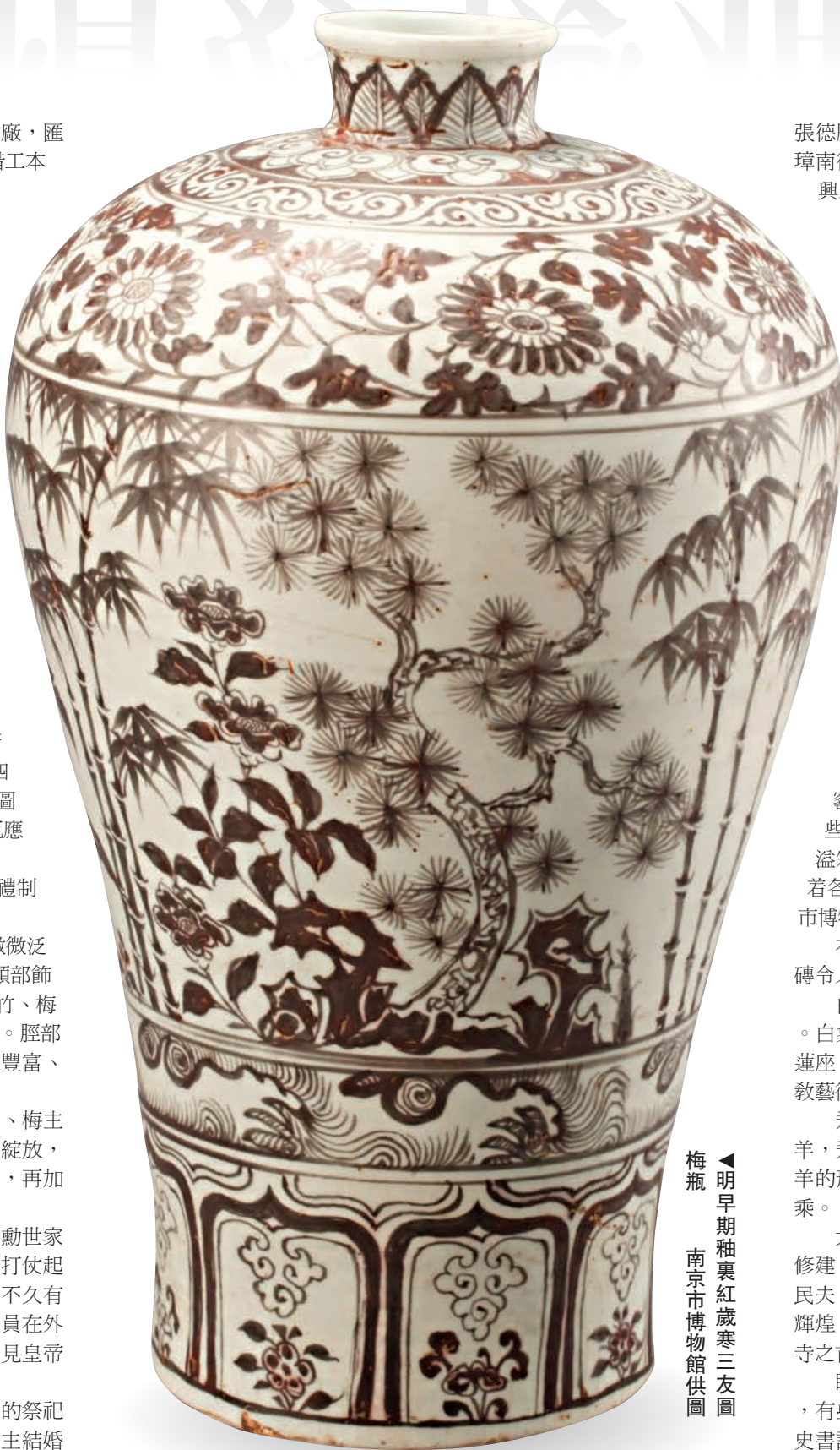
▲明早期釉裏紅歲寒三友圖

一九七〇年十月，南京市文物保管委員會考古人員在中央門外發現一座明代長方形券頂磚室墓，墓室分上下兩層，各用磚壁間隔成前後兩室。墓內共出土隨葬器物七十四件，有金銀飾品、陶瓶、瓷器、銅飾、鐵質武器等，其中一副「鑲金托雲龍紋玉帶板」令考古人員震撼。從墓誌得知，此為明代開國功臣汪興祖的墓葬。