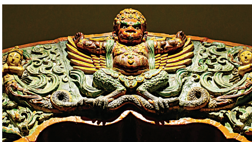
▲大報恩寺琉璃塔琉璃構件