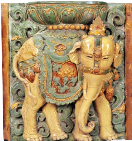
▲白象紋琉璃磚

毀於一八五六年太平天國的戰火中的高達七十八點二米琉璃塔的「通體琉璃，獨步古今」，如今只能憑藉這些美輪美奐的琉璃構件來拼接與構想。