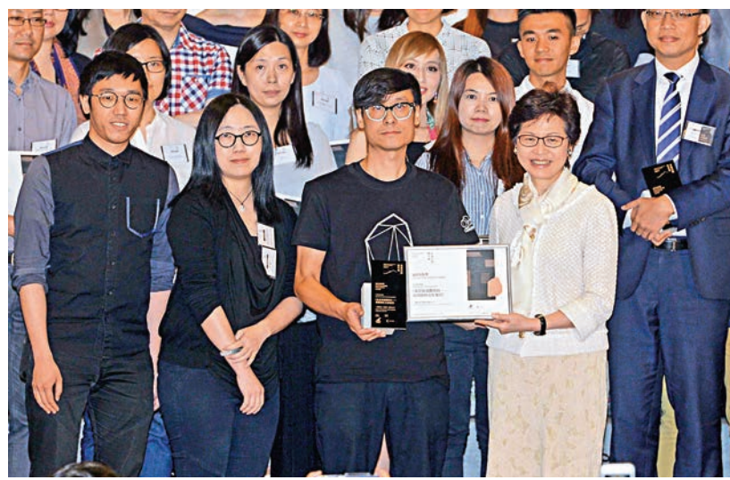
▲行政長官林鄭月娥（前排右一）為「最佳出版獎」得獎者頒獎

雙年獎是首個屬於本港出版業界的專業獎項，由「創意香港」贊助，商務及經濟發展局、民政事務局、香港藝術發展局、香港貿易發展局及香港出版總會支持。雙年獎共設十個獎項類別，分別為文學及小說、藝術及設計、社會科學、商業及管理、生活及科普、心理勵志、語文學習、兒童及青少年、圖文書及電子書，每個類別各設有一個「最佳出版獎」及九個