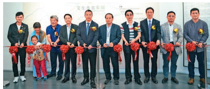
▲眾嘉賓為展覽開幕剪綵