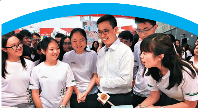
▲楊局長同年輕人行書展，分享讀書心得