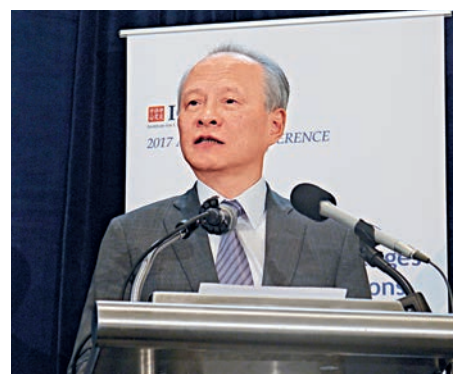
▲25日，崔天凱在華盛頓出席「中美關係的前景與挑戰」研討會

關於南海問題，崔天凱說，其核心是領土主權和海洋權益爭議，不是中美之間的戰略博弈。有關爭議應由直接有關的當事國協商解決。