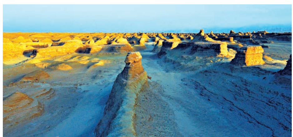
▲青海海西州自然環境與火星相似

青海省海西州委副書記王敬齋指出，海西州地理形態多樣。州域沙漠化面積9.5萬平方公里，瀚海戈壁一望無際，擁有中國最大的雅丹地貌群。獨特的地形地貌、自然風光、氣候條件與火星表面極其相似。