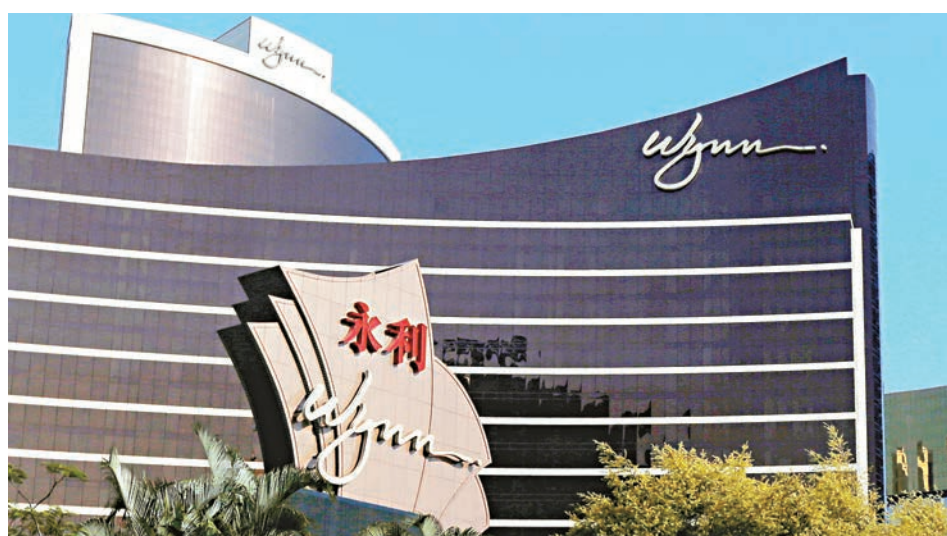
▲永利娛樂場業務經營理想，帶動上半年純利增長五成

儘管次季業績優於預期，惟永利澳門股價逆市向下，更以全日最低16.74元收市，跌逾4%。兩隻藍籌賭股亦報跌，銀河娛樂