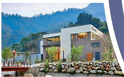
▲谷野溫泉會館（台中）