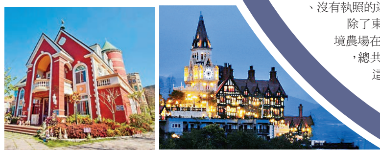
▲歐莉葉荷城堡(南投) ▲老英格蘭莊園（南投）

美國有線電視新聞網CNN去年評選出台灣10大絕美民宿，每間都生意興隆、一房難求，但令人傻眼的是，有台灣媒體踢爆這10家民宿中竟只有一家完全合法。島內法律界人士批評當局裝聾作啞。有學者呼籲應修改不合時宜的法令，讓民宿成為台灣特色觀光產業。