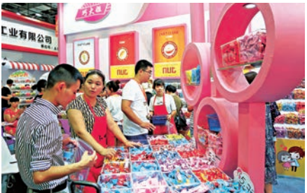
▲首屆海峽兩岸食品交易會被譽為兩岸「甜蜜盛會」

不能停，尤其是在食品安全問題上。」當前兩岸相關部門對食品安全愈來愈重視，若能在食品安全上聯手，逐步建立具有民間性質且國際認證的檢驗檢疫機構作為第三公證方的食品安全機制，將能讓兩岸民眾放心，造福民眾健康。