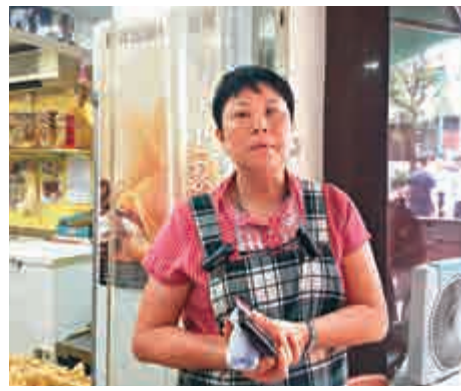
▲海味店鄭小姐稱每年都有進行維修，從無石屎脫落、滲水等問題