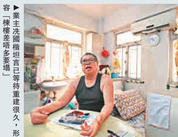
▲業主洗國楷坦言已等待重建很久，形容「棟樓差唔多要塌」