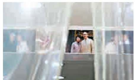
▲海味店貼滿明星客人的照片

【大公報訊】記者趙凱瑩、實習記者鄧淑姿報導：位於西營盤、逾60年歷史的海味店，將面臨重建考驗，舖位位處窄巷，卻是劉德華、曾志偉等名人「幫襯」的熱點，面對店舖將被收回，手持同街四個