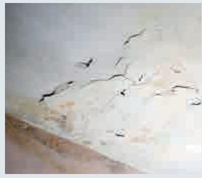
▲天花板及牆身都有剝落和滲水

期，擔心業主得知重建後不續租，又指目前已申請公屋六年，希望市建局今次收樓能讓她加快上公屋。