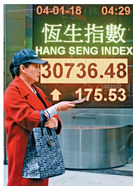
▲港股連升八日，主板成交連續多日破千億