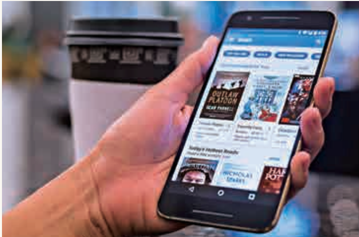
▲久已被市場遺忘的電子閱讀器，今年可望再掀熱潮

除了彩色電子閱讀器將成為今年的大熱門外，在過去三四年間一直發展的、可使用Android應用的電子閱讀器，今年也將會大有發展。不少歐洲公司將繼續推出可以完全使用Android的電子閱讀器，而多個軟件程序應用商店也可供下載專門為電子書而設的應用軟件、遊戲或是包括雜誌、漫畫和報章的數碼版本。