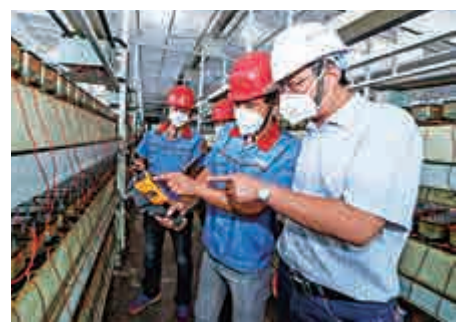
▲浙江長興縣一家企業，安全生產負責人進行安全巡查 資料圖片

【大公報訊】據新華社報道：中共中央辦公廳、國務院辦公廳近日印發《關於推進城市安全發展的意見》，要求促進建立以安全生產為基礎的綜合性、全方位、系統化的城市安全發展體系，全面提高城市安全保障水準。